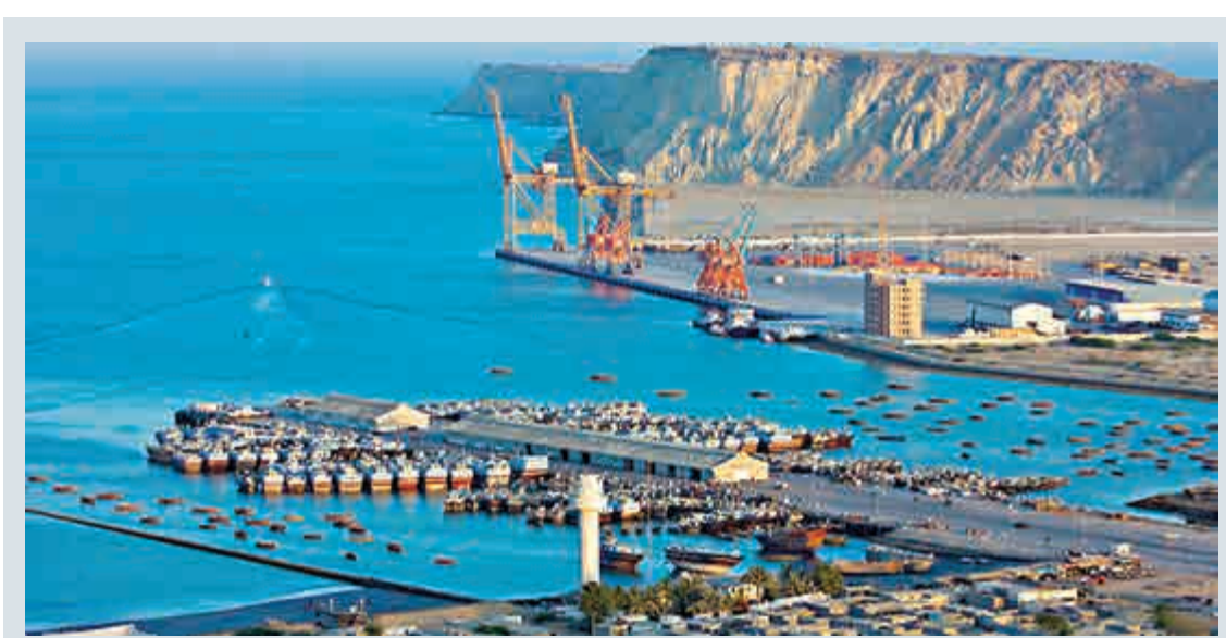
▲在建中的瓜達爾港