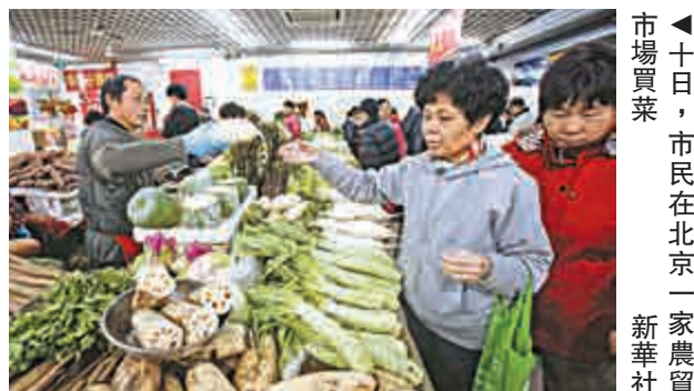
▲十日，市民在北京一家農貿市場買菜