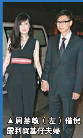
▲周慧敏(左)偕倪震到賀基仔夫婦