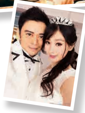
►樊少皇在微博張貼婚照