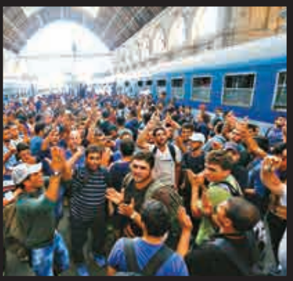
▲法國今年預計收到避難申請約6.5萬份 資料圖片

有幫助敘利亞難民們的志願者介紹說，難民們會通過社交網絡交流信息，他們覺得「對難民來說，法國不是一個好的目的地。」