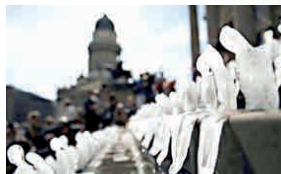
巴西藝術家Nele Azevedo的「融化人」系列作品，旨在呼籲人們關注全球暖化問題