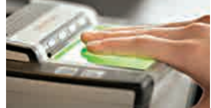
▲上月12日起，法國在華簽證中心開始啓用採集生物數據系統 資料圖片

心開始啓用採集生物數據系統，中國公民在申請法國神根簽證時，將被要求錄入十指指紋和提供一張數碼照片。目前