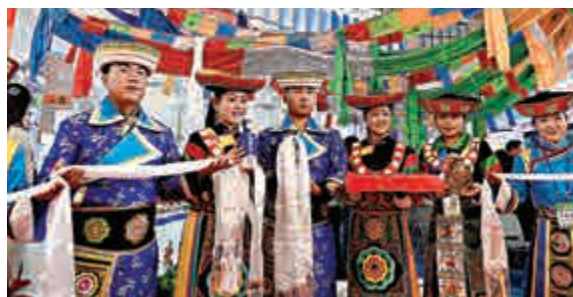
▲13日，工作人員在旅遊大會推介旅遊服務

緬甸旅遊和酒店部的高級官員慕慕表示，他期待未來兩國的旅遊客源往來能夠更加均衡，促進緬甸國內經濟增長。