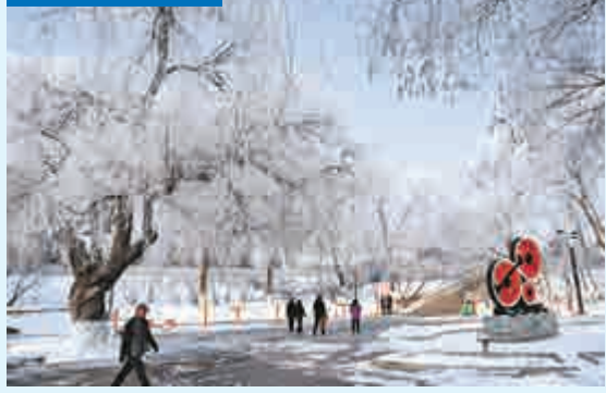
11月13日，黑龍江省牡丹江市區出現霧凇景觀，吸引衆多市民和攝影愛好者走出家門記錄美景。