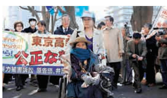
▼2009年中國慰安婦索賠案在東京高等法院開庭審理 資料圖片