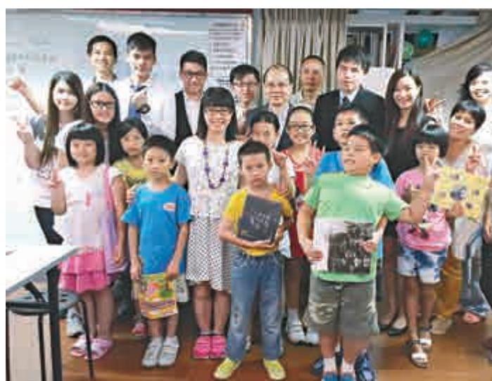
▲當局指出有責任處理有關保障兒童問題，圖為張建宗早前到訪「社區新世界」社區中心

【大公報訊】勞工及福利局局長張建宗昨日出席一個探討兒童問題的論壇時表示，政府將於本月底推出有關香港兒童法的白紙草案，並進行為期四個月的諮詢。張建宗表示，政府有責任保障兒童權益。終審法院首席法官馬道立指，現時本港有關子女管養權的法律，在保障兒童權益問題上處理得不理想，認為需要關注本港兒童福利制度不足。