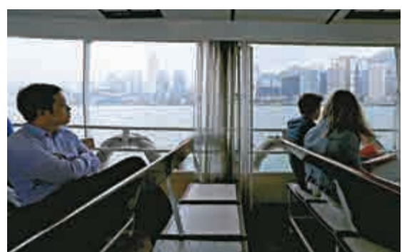
▲陳李藹倫表示，樓價仍高企，與市民供款脫節，政府有需要維持需求管理措施

【大公報訊】記者楊致珩報道：本港第三季住宅物業市場轉趨淡靜，成交量按季大減超過一成，樓價升幅亦放緩至1.5%，政府經濟顧問陳李藹倫表示，九月整體樓價仍較97年高峰超77%，樓價仍高企，與市民供款脫節，置業供款負擔比第三季升至64%，顯示樓市泡沫仍顯著，政府有需要維持需求管理措施。財政司司長曾俊華指，市場一般預期美國會在十月加息，一旦加息，市民還款負擔會受影響，呼籲市民置業時要謹慎小心。