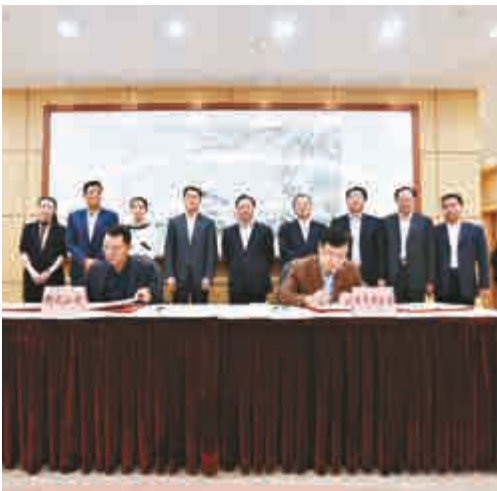
▲東莞市政府與騰訊簽約合作打造智慧城市