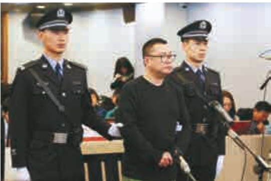
▲今年2月28日，尹相杰曾因非法持有毒品罪，被判處有期徒刑7個月。圖為當日庭審現場

經核實，尹某某即為歌手尹相杰。他曾於去年12月25日晚間，因涉毒被北京警方抓獲。之後經法院審理，法院以非法持有毒品罪，判處其有期徒刑7