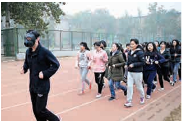
▲連日霧霾天氣致濟南空氣質量嚴重污染，濟南一名大學生戴防毒面具晨練 中新社

根據PM2.5（細顆粒物）、PM10（可吸入顆粒物）、二氧化硫、氮氧化物等多項污染物濃度評定，京津冀區域空氣質量較9月份明顯下降。其中PM2.5是首要污染物。（中新社）