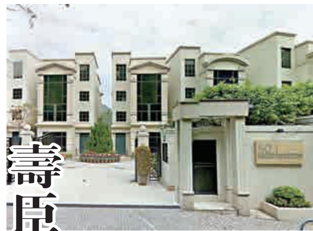
▲壽臣山道東一號外貌

【大公報訊】優質豪宅租盤受追捧，澳門一代賭王傅老榕後人傅厚澤家族或有關人士持有的壽臣山道東一號單號屋，剛以月租15.4萬元租出，實呎租金58元，較上月租出的雙號屋呎租51元升13%。