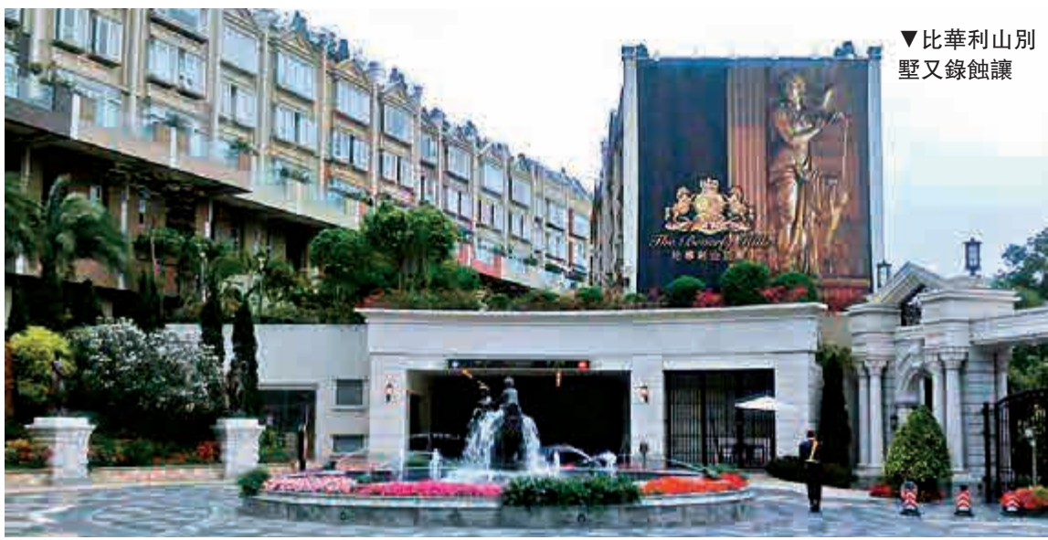
▼比華利山別墅又錄蝕讓

銀主盤隨市況不穩增多，新入伙盤也極速現銀主盤。市場消息指，入伙僅年多的長沙灣一號·西九龍首現銀主盤，單位為二座高層A室四房戶，實用