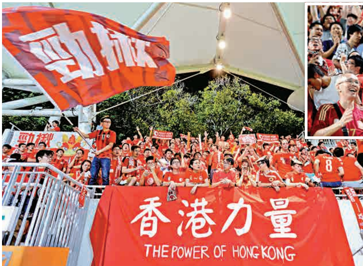
▲球迷們比賽期間大叫「香港加油」，為港隊打氣，又不時製造「人浪」，氣氛熱烈

精彩的賽事最終以零比零告終，除憂慮中國隊未能晉級的球迷略感失望，大部分香港球迷離場時對港隊表現滿意，球迷離場時秩序大致良好，賽後旺角沒有人乘機鬧事佔路。