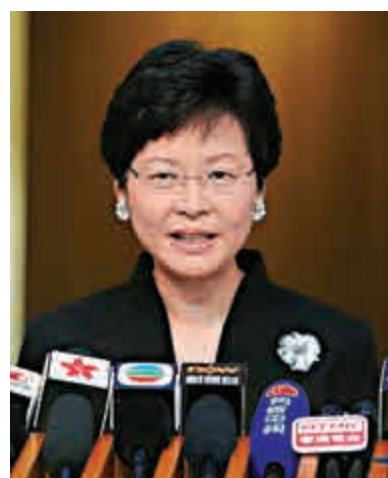
◀林鄭月娥表示，支持香港隊打一場精彩球賽，相信兩隊均會悉力以赴，互相尊重，最重要的是體育精神

食物及衛生局局長高永文昨日出席公開活動後稱，作為「香港的中國人」，他兩隊都支持，相信在體育精神之下，最重要的是兩隊都能發揮應有的水平，合演一場非常高水準的足球賽事，這才是廣大香港市民和球迷樂見。公務員事務局局長張雲正昨日於立法會表示，自己最愛足球，「兩隊都撐，最重要大家盡力。」立法會主席曾鈺成日前已表示，香港市民當然撐港隊，認為國家隊與外國比賽便支持國家隊，但如國家隊與地方隊比賽，當地人支持自己人亦是自然不過的事。