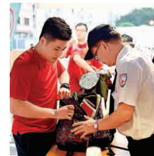
▲進場時安檢嚴密，水樽、雨傘等硬物不准帶入場，須核對門票及身份證