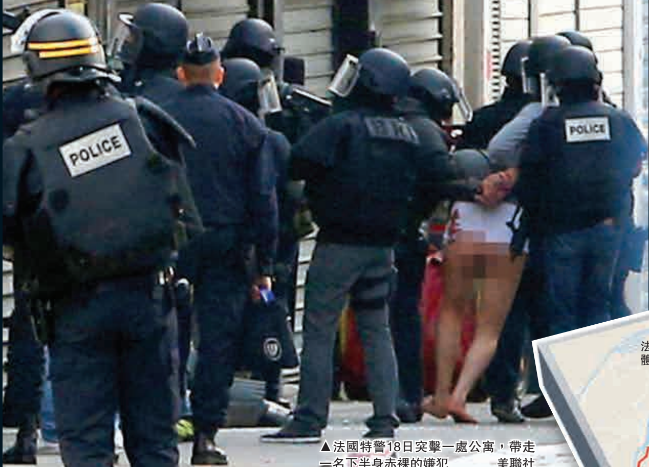
▲ 法國特警18日突擊一處公寓，帶走一名下半身赤裸的嫌犯