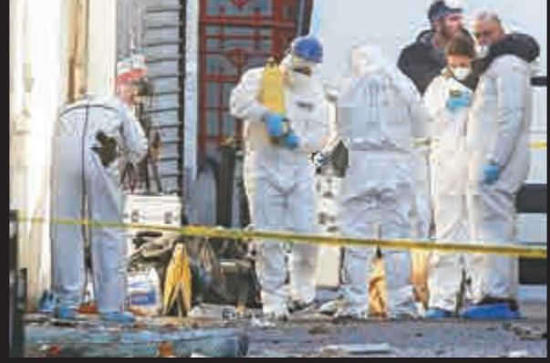
◀ 證鑒科人員在突擊結束後到現場取證