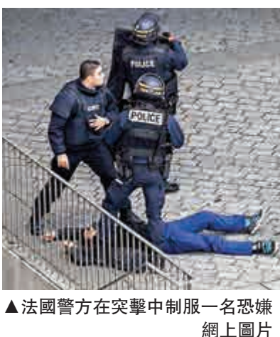
▲ 法國警方在突擊中制服一名恐嫌