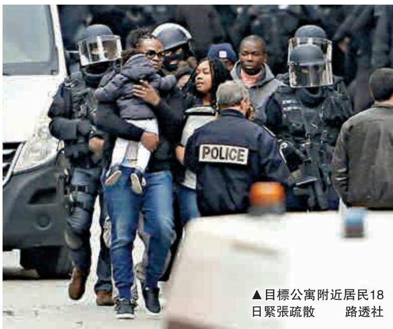
▲ 目標公寓附近居民18日緊張疏散

【大公報訊】綜合法新社、路透社、英國《衛報》及《每日郵報》報道：法國「黑豹」特警隊18日突擊巴黎北郊的聖丹尼市一處公寓，相信是13日恐襲主謀阿巴伍德匿身處，行動險象環生，其間一名女恐嫌突然引爆炸彈背心自殺，另有一名男恐嫌死於手榴彈爆炸。全程7小時突擊落幕，警方逮捕7名恐嫌，但法警尚未證實死者或落網者是否包括阿巴伍德。