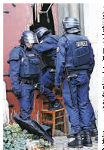
◀ 法國警方18日攻入一間可疑教堂

分人口都沒有正式身份，因此無法在當地合法工作。聖丹尼和周五發生爆炸的法國西大球場位於同一區域，而通往聖丹尼的道路也已被封鎖。