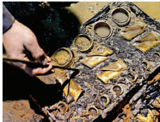
▲考古人員清理江西南昌西漢海昏侯墓出土的馬蹄金

北京交通管理局官方微博發布消息稱：22日，北京界內多條高速公路採取了臨時封閉措施；京津高速大湖收費站至市界出京方向、京滬高速大羊坊收費站至市界出京方向、京平高速夏各莊至市界出京方向和京哈高速白鹿至市界雙向均採取封閉措施。