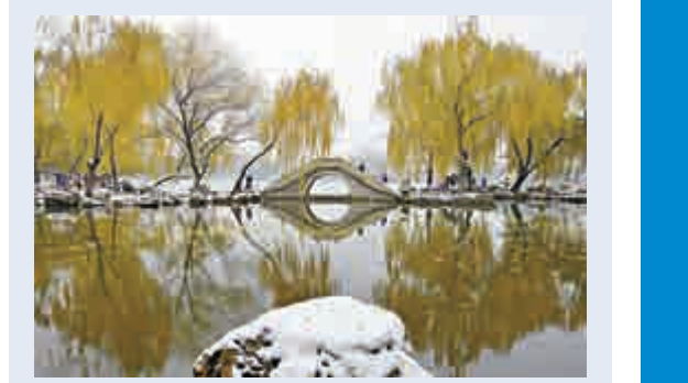
楊柳湖影映白雪 22日，北京迎來今冬最大一場降雪，紫竹院公園裏構成了楊柳湖影映白雪的難得景象。

華僑大學校長賈益民教授表示，「一帶一路」建設將進一步提升世界範圍內的「華文熱」和「漢語熱」，促進華文教育的轉型升級；創造新的文化環境和氛圍，促進中外文化交流更加頻繁、內容更加豐富和中華文化傳播更加廣泛和深入。國際華文教學研討會將每兩年舉辦一次，旨在為國內外華文教育及漢語國際教育領域學者搭建溝通和交流的學術平台，推動學科發展。（記者 林苑）