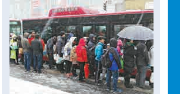
大連今冬首雪 22日午後，遼寧大連迎來今冬首場大範圍降雪，雪量達中雪級別。路上行人頭戴棉帽臉戴口罩，身穿棉服包裹嚴實。（記者 宋偉）