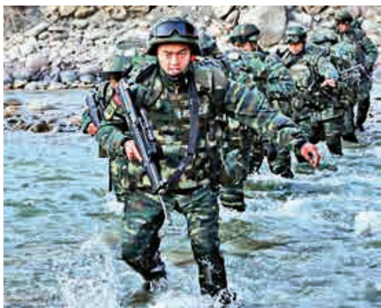
▲武警新疆總隊四支隊特勤中隊執行捕獲任務

中國駐馬里大使館已將獲救的4名中國公民接往大使館，妥善安排其餐飲住宿，並關心4名中國公民的離境等事宜。對於遇難者同胞的屍體，中國駐馬里大使館正在設法妥善安置，並與國內相關部門密切聯繫，全力善後。