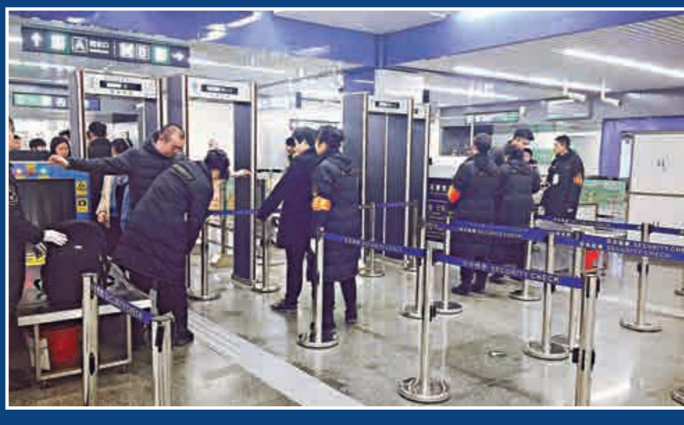
▲北京地鐵加強安檢措施