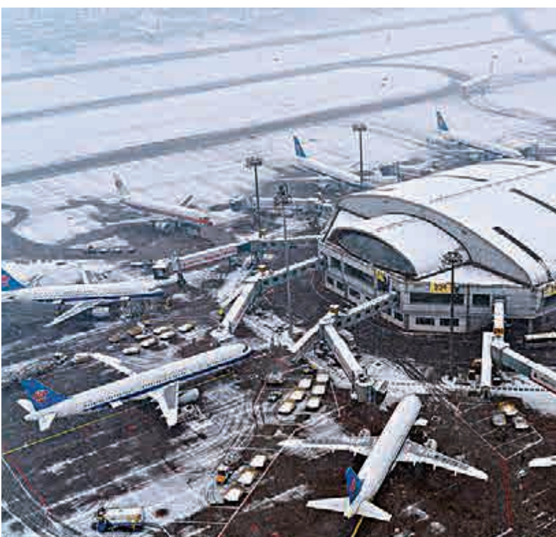
▲22日北京大雪，首都機場多架次航班取消或延誤

【大公報訊】據中新社、新華社報道：22日，華北地區普降中到大雪。大雪致京滬高鐵、京廣高鐵、京津城際、津秦高鐵限速運行，部分旅客列車晚點。北京首都機場167架次出港航班也被取消，逾20班來往北京與香港航班因大雪延誤。