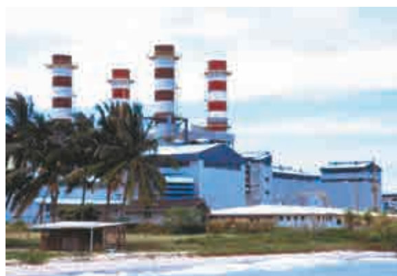
▲中廣核收購的一所位於馬六甲的天然氣發電廠

【大公報訊】據中新社報道：當地時間11月23日下午，中國廣核集團有限公司（以下簡稱中廣核）與馬來西亞埃德拉全球能源公司（Edra Global Energy Bhd，簡稱埃德拉公司）在吉隆坡簽署了埃德拉公司下屬電力項目公司股權及新項目開發權（以下簡稱「埃德拉項目」）的股權收購協議。