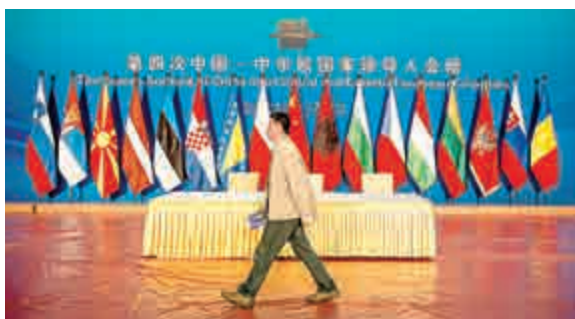
▲23日，一名記者在中國—中東歐國家領導人會晤會場

【大公報訊】據新華社、中新社報道：中國國務院總理李克強24日將在蘇州與中東歐16國領導人一起，舉行第四次中國—中東歐國家領導人會晤，就進一步促進中國與中東歐國家合作發展深入交換意見，共同搭建起通往「1+16合作」未來的無數新通道。 此次會晤的主題是「新起點新領域新願景」，在外交學院副院長王帆看來，此次會晤是「1+16合作」進程中的一個重要節點，將推動中國—中東歐關係穩步向前發展，為中國外交的「歐洲季」注入新動能，有利於歐洲各個次區域的均衡發展，助力歐洲一體化進程。