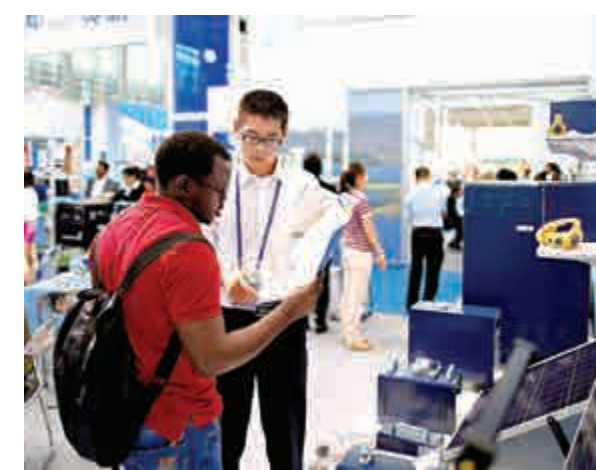
▲中國企業在廣交會上向外商介紹太陽能產品 資料圖片

金融合作上，上海將在滬金市場交易系統的報價、成交、清算等功能拓展至「一帶一路」沿線國家和地區，重慶則舉辦系列境外投資促進活動，促進跨境投融資匯兌便利化等。