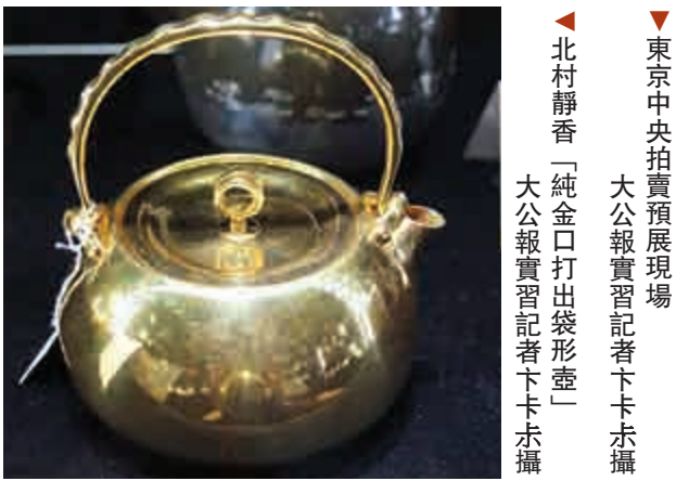
▲東京中央拍賣預展現場 大公報實習記者下卡卡攝 北村靜香「純金口打出袋形壺」 大公報實習記者下卡卡攝