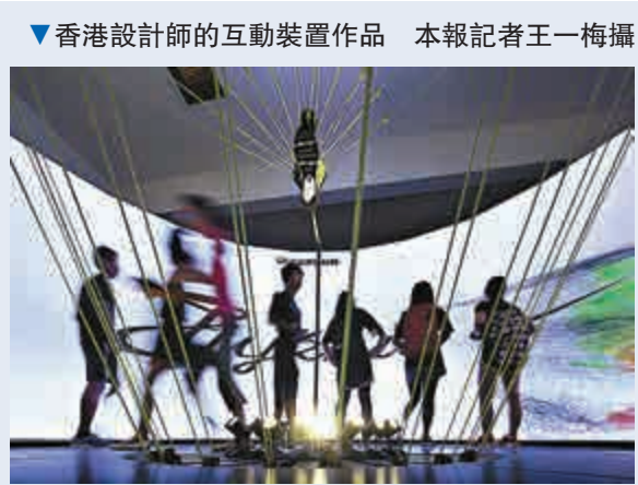
▼香港設計師的互動裝置作品 本報記者王一梅攝