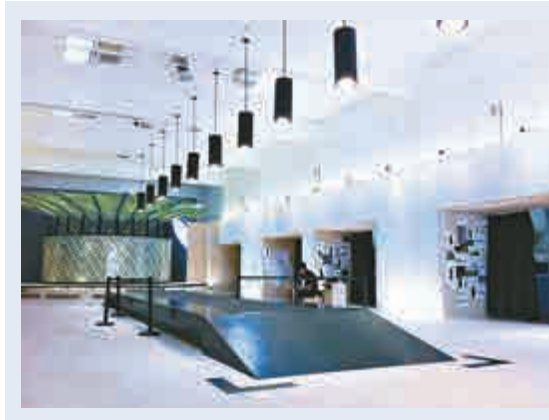
▲香港設計師的獲獎作品

香港XCEED團隊獲獎的作品是Flyknit Multiply互動裝置，是展示於上海體育場舉辦的Nike Festival of Sports 2012的新媒體藝術作品。結合視覺元素、最新身體感應技術以及連結社交網路平台，互動新媒體藝術的體驗帶領各共通點至另一層次。靈感來自編織技