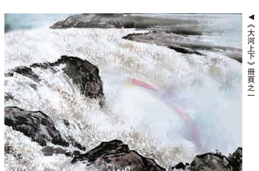
▲《大河上下》冊頁之一

的狀態，也為林勇遜後來在香港藝壇、嶺南的狀元，做好充分準備。 八十年代初，林勇遜獲准隻身來港定居，狀若「青聽入錦城」，實是孤軍哀兵從頭。全仗當初的苦練修為，真善美的傳統內涵和筆墨純熟的寫實技巧，令他的作品很快掛滿港九食肆酒店，丹青弟子日漸人滿為患，榮銜崇譽難以推脫，終令當年因緣際會的佳話結出四十年後的藝術善果。