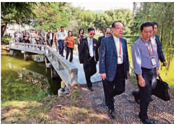
中醫城在綠樹竹林掩映中顯得醒目而古樸