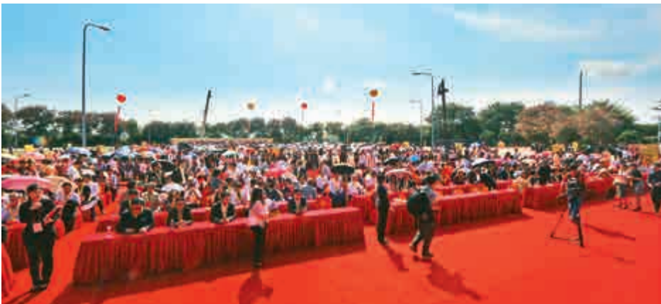
2000名賓客共同見證中國最大的中醫城落成啓用