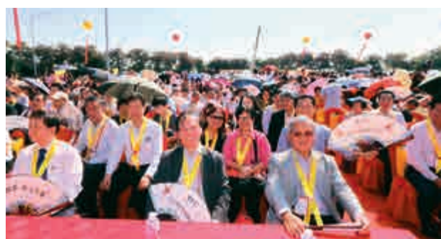
代表團全體成員在廳陽底下祝賀中醫城開幕