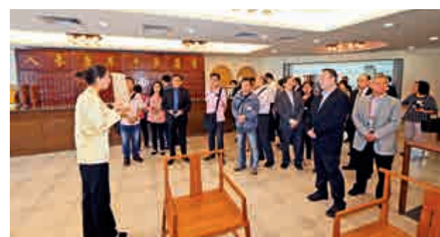
代表團成員專心聆聽鶴年堂職員對中醫中藥的講解