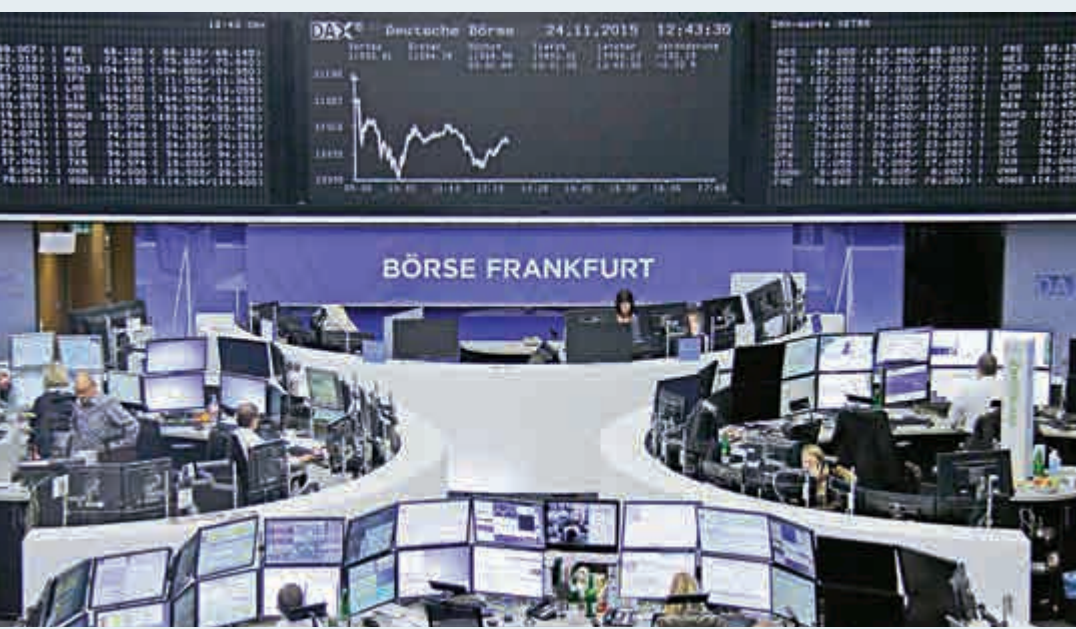
昨晚突傳出土耳其擊落俄羅斯軍機消息，環球股市應聲急挫，首當其衝是歐洲股市，初段下挫1%。

繼高盛之後，大摩也加入了唱好新經濟的行列。有意思的是，在A股市場連續三年由新經濟主導之後，港股市場也出現了向新經濟傾斜的力量。2016年，大市極有可能進入新經濟主導的一年。