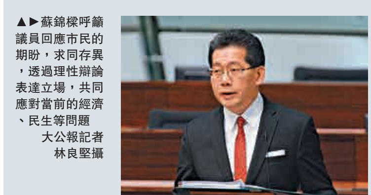
▲蘇錦樑呼籲議員回應市民的期盼，求同存異，透過理性辯論表達立場，共同應對當前的經濟、民生等問題。