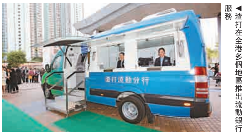
渣打在全港多個地區推出流動銀行