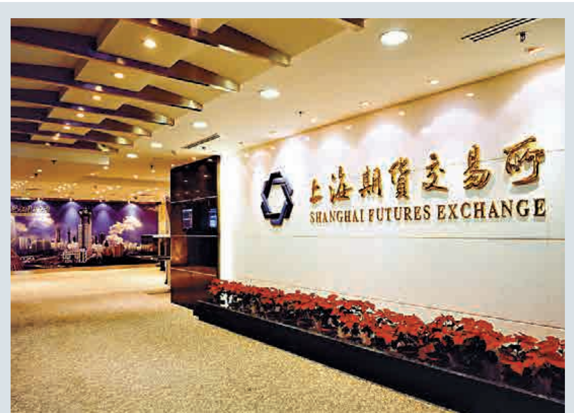
▲據悉，中國有色金屬工業協會已要求當局調查上海期貨交易所發生「惡意」沽空金屬行為