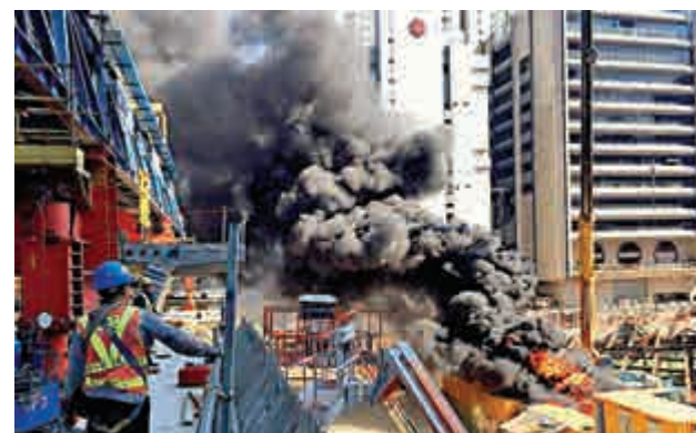
▲地盤內貨櫃失火烈焰濃煙冲天

【大公報訊】消防處接獲投訴葵涌區內疑有非法加油活動，遂派出反非法加油特遣隊進行巡查，昨晨十時許在葵涌葵泰路發現一輛可疑中型密斗貨車，遂上前將該車截停，發現車內貨斗內藏一個懷疑非法改裝巨型油缸，內有3000升油渣，遂將該車司機兼車主拘捕，不排除會檢控有關罪名。