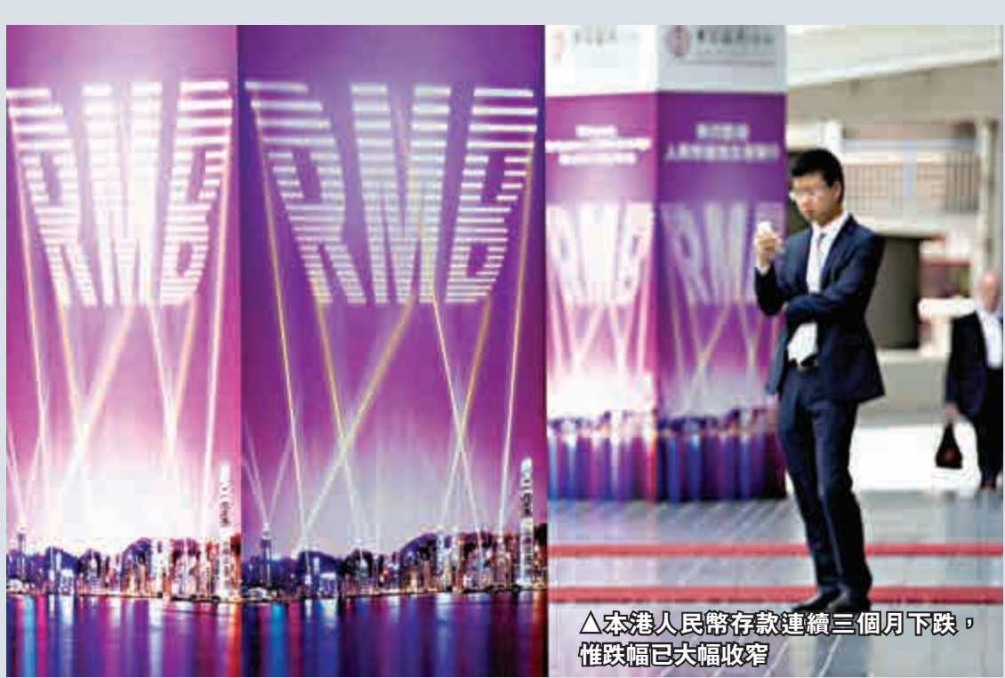
△本港人民幣存款連續三個月下跌，惟跌幅已大幅收窄