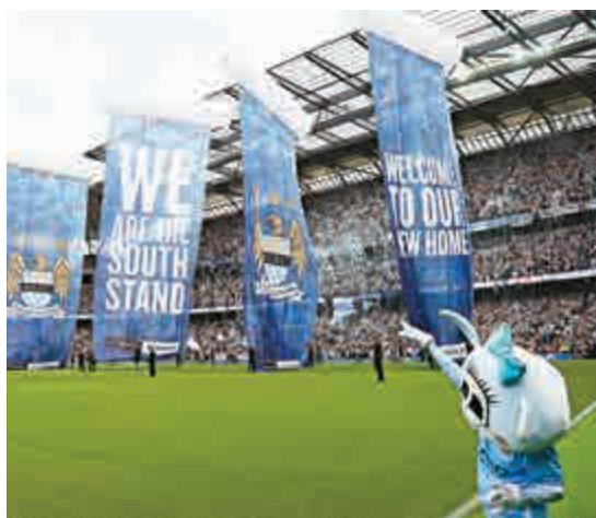
▲曼城近季在英超成為爭標主要分子