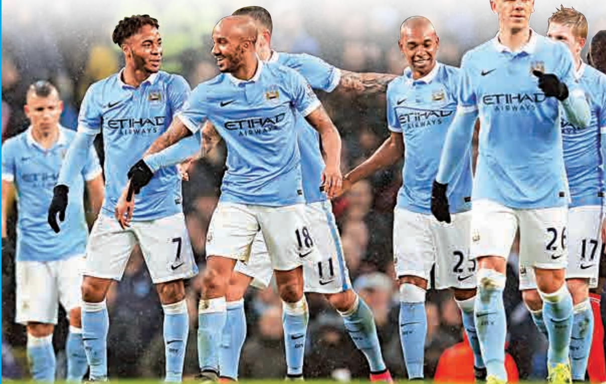
▲曼城暫於英超領導群雄