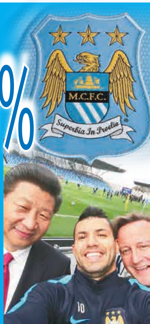
▲曼城前鋒阿古路（中）在早前於社交網站上載一張與習近平（左）及卡梅倫的自拍照片

CMC今年10月底宣布，以80億元人民幣投得中超未來5年的播映權，另亦擁有中國男女子國家足球隊、大學生足球聯賽、世界冠軍球會杯、德國甲組聯賽等的播映權。