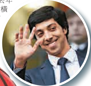
▲阿聯酋王子曼蘇爾是曼城的班主

此外，CFG又於去年入股日本職業聯賽球會橫濱水手，但持股量只有約20%，未有控制權。