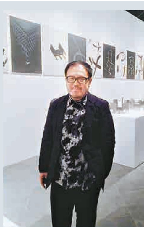
「身份決定設計」展廳

其中一件展品是他於二〇〇四年為「香港當代文化中心」統籌的「城市文化交流會議」設計的海報。劉小康首先思索這四個城市，包括香港、深圳、上海