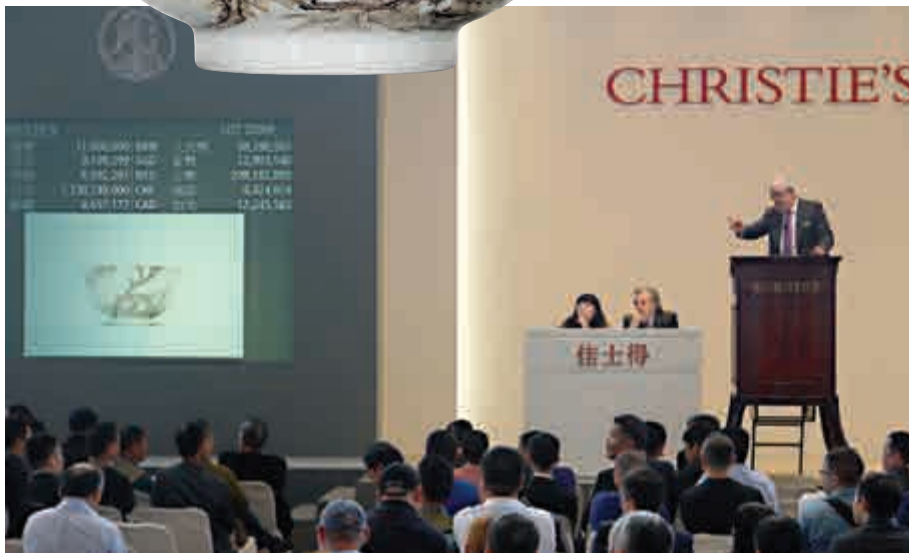
▲香港佳士得為清雍正珐瑯彩繪墨梅竹圖碗另闢專場，足見重視