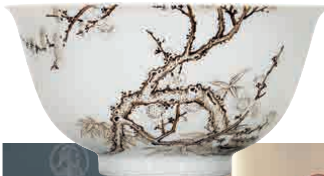
▲清雍正珐瑯彩繪墨梅竹圖碗成為全日成交價最高之陶瓷拍品，一千四百萬港元起拍，八千五百二十四萬港元成交