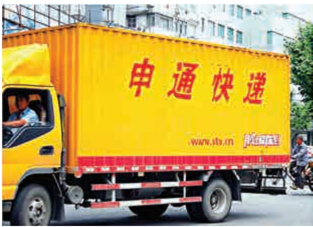
▲申通快遞借殼艾迪西上市，交易完成後，有望成為A股快遞第一股

【大公報訊】申通快遞有望成為A股首隻快遞概念股。艾迪西(002468)周二公告顯示，擬出售目前所有資產和負債，並以增發股份及現金方式收購申通快遞100%股權，資產價值169億元(人民幣，下同)。