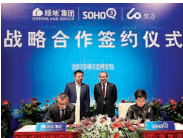
▲綠地控股昨日分別與SOHO3Q，及優辦簽署戰略合作協議，共同拓展共享辦公空間和「互聯網+商業樓宇租賃」市場

通過本次交易，上市公司將置出當前經濟形勢下盈利能力較弱、發展空間有限的水暖器材研發、製造、銷售與服務業務，置入盈利能力較強市場快速增長、發展前景廣闊的快遞服務業務，實現上市公司主營業務的轉型。