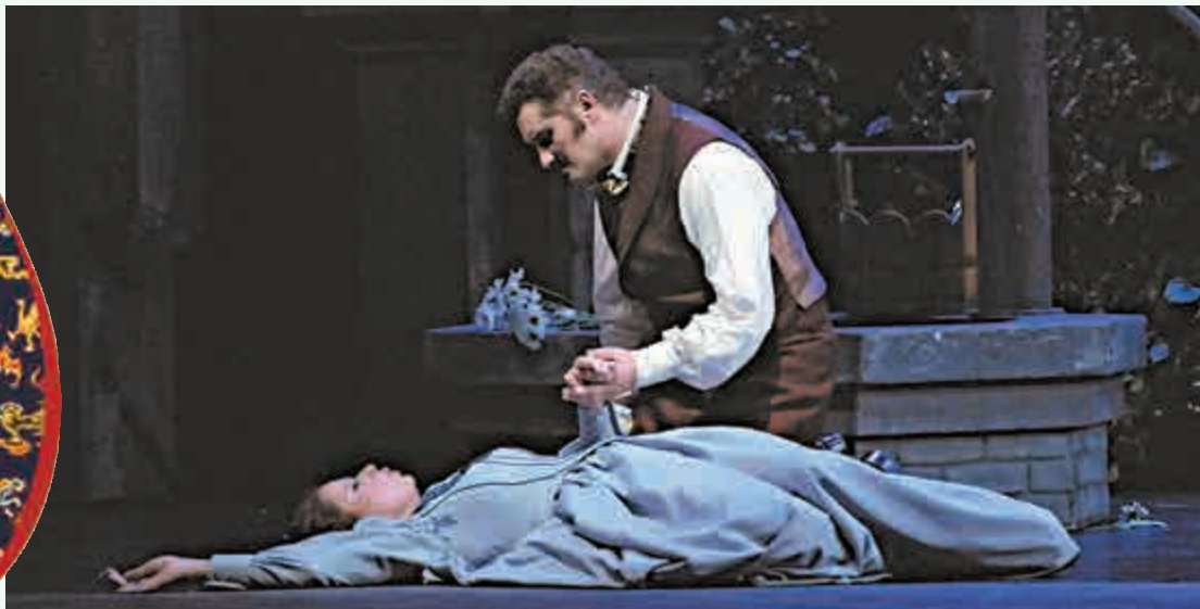
▶在澳門國際音樂節演出的歌劇《浮士德》 芝加哥歌劇院演員演出歌劇《浮士德》