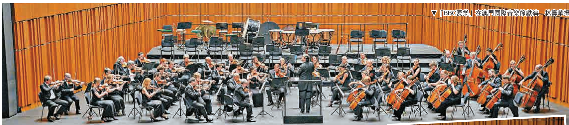
▽「BBC愛樂」在澳門國際音樂節獻演