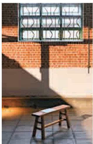
◀展覽：John Cage《梳剔的書寫》

【大公報訊】西九文化區博物館M+「M+ 進行：藝活」展覽於昨日舉行傳媒預展，該項目橫跨香港八個地點，透過一系列跨領域的現場展演及展覽展示二十及二十一世紀視覺文化，探討當代藝術中「活」的狀態。