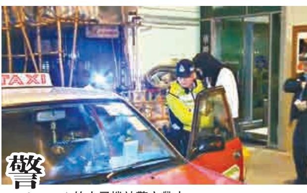
▲的士司機被警方帶走

【大公報訊】警方銳意打擊的士濫收車資罪行，前晚在港島區展開行動，派員喬裝遊客，在皇后大道西和干諾道西拘捕兩名的士司機，分別涉濫收車資及未有將的士計程表指示器撥到開始記錄位置被捕，警方指濫收車資是嚴重罪行，呼籲的士同業切勿以身試法。