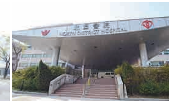
警方在文錦渡截獲肇事凍櫃車後，拖到大樓車輛扣留中心調查

及至昨日上午11時左右，即約事發九小時後，警方終在文錦渡邊境管制站範圍截獲該輛掛有粵港車牌、車頭損毀、擋風玻璃爆裂、左邊車頭燈失去的可疑