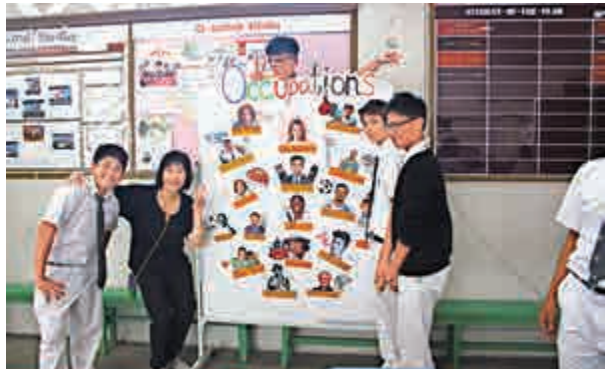
▲玫瑰崗學校（中學部）學術周活動，讓學生「寓學於樂」

「知識是智慧的火炬。」六天的學術周活動透過不同方式讓同學愉快學習，讓學生學會了不少知識，也樂在其中。