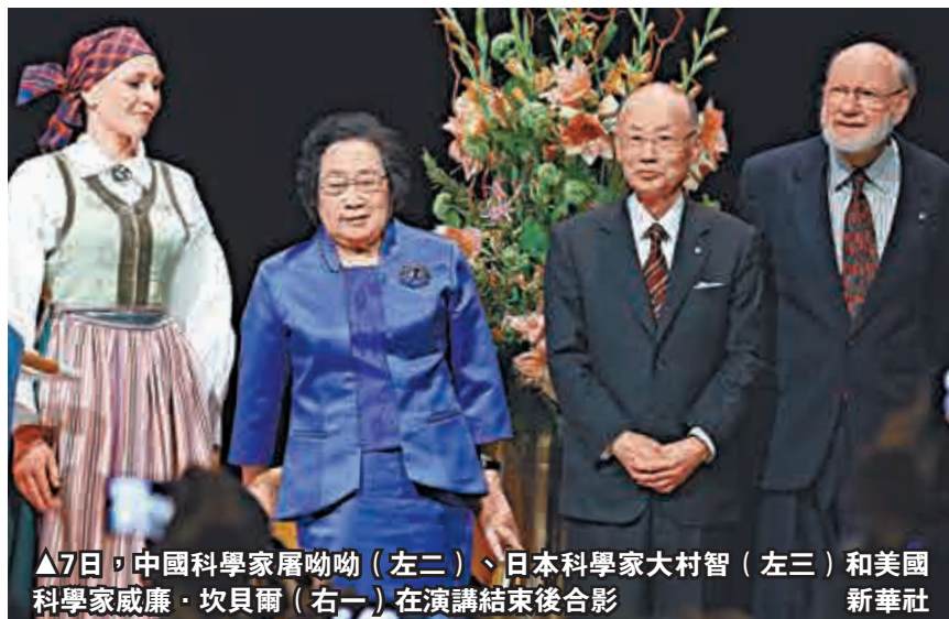
▲7日，中國科學家屠呦呦（左二）、日本科學家大村智（左三）和美國科學家威廉·坎貝爾（右一）在演講結束後合影

最後，屠呦呦引用「欲窮千里目，更上一層樓」作為演講的結束語，並且祝福在場的科研工作們在各自研究領域都能再上一層樓。