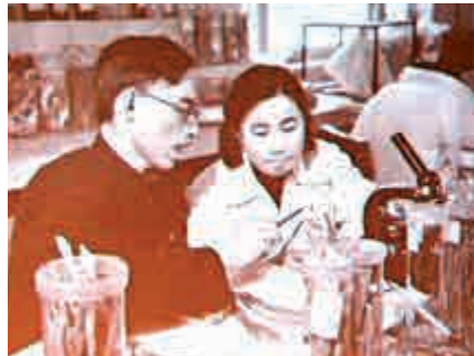
▲屠呦呦在演講中介紹其在中藥研究所的工作