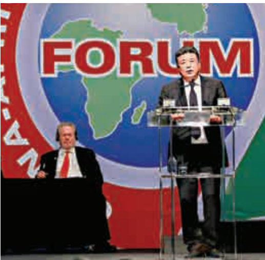
▲中國交通建設集團董事長劉起濤

劉起濤代表通商非洲的中資企業發出五點倡議：一是按照「真、實、親、誠」的工作方針在非洲開展各項業務，將誠信打造成中國品牌的核心。二是始終珍惜非洲良好的生態環境，達到人與自然的