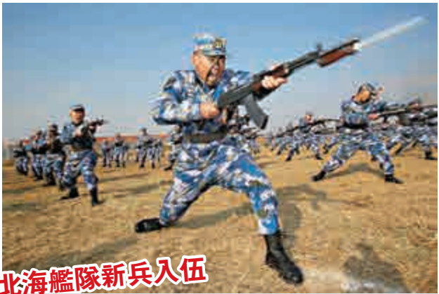
北海艦隊新兵入伍

目前，當事人已被刑事拘留。海關表示，根據槍支管理的相關規定，非制式槍支當所發射彈丸的槍口比動能大於等於1.8焦耳/平方厘米時，一律認定為槍支，均屬於禁止進出境物品。旅客攜帶槍支2把以上(含2把)入境，將可能面臨刑事責任。