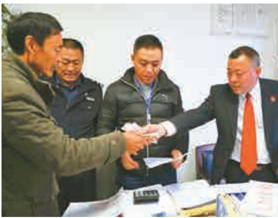
▲河南鄭州法官在為農民工發放執行款

【大公報訊】記者段曉燕鄭州報道：不足20天裏，中國農業大省河南共受理1萬餘宗涉農維權案，涉案金額高達近5億元（人民幣，下同），其中，受理拖欠農民工工資案件6717件，涉及農民工10300人，涉案金額3.14億元。