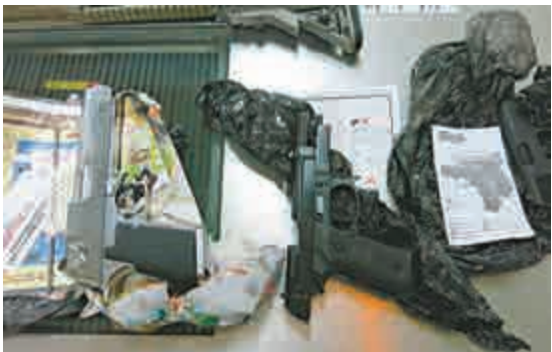
▲深圳海關查獲的部分手槍

【大公報訊】記者石華深圳報道：深圳羅湖海關近日就查獲了一宗走私手槍入境案，共查獲仿真槍6把，仿真槍配件2個，塑料BB彈100粒，其殺傷力與手槍一樣，當事人是一名93年出生的香港男子，如今已被刑事拘留。