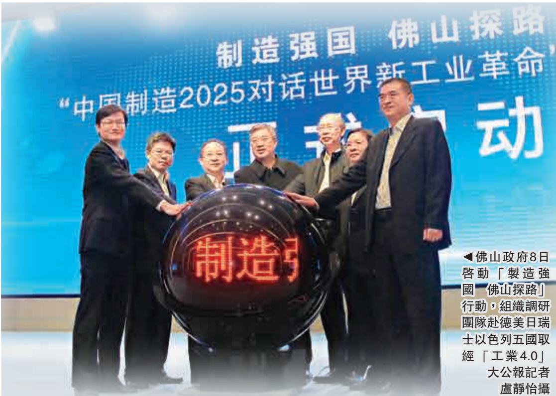
▲佛山政府8日啟動「製造強國·佛山探路」行動，組織調研團隊赴德美日瑞士以色列五國取經「工業4.0」

「佛山近期還有望獲批成為國家製造業轉型升級改革試點城市。佛山一直努力探索破解製造業轉型。」魯毅稱，今年前10月，佛山規模以上工業增加值近3500億元人民幣，總量和增速均位居珠三角前三名。