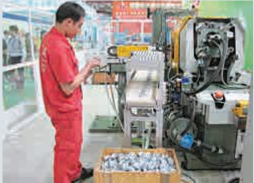
▲珠三角不少企業已經開展機器換人

【大公報訊】記者盧靜怡佛山報道：在今年「中國製造2025」國家戰略推出後，「製造2025」成為內地各市近期陸續出台的「十三五」規劃建議中的熱門議題。其中，作為製造業大省的廣東更是在粵版「製造2025」提出，到2020年智能裝備產業增加值達4000億元（人民幣，下同）。在廣東製造業最為集中的珠三角，除佛山外，不少城市也在加快實行地方版「製造2025」規劃。