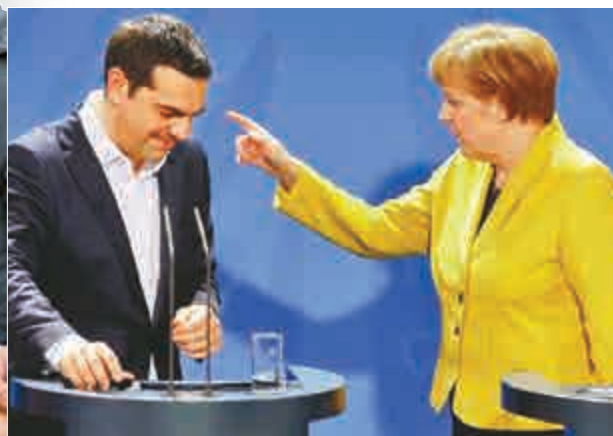
▲德國總理默克爾與希臘總理齊普拉斯(左)