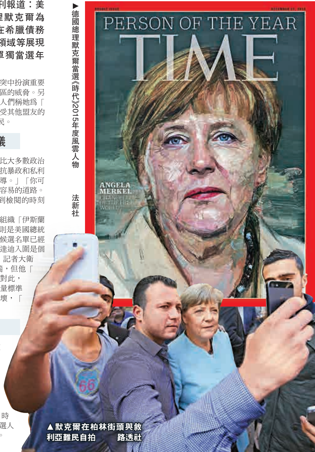
▲默克爾在柏林街頭與敘利亞難民自拍