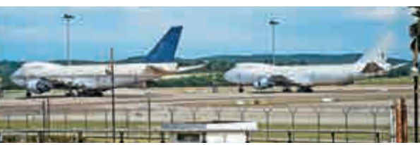
▲其中兩架無人認領的波音747飛機

3架飛機機身均沒有航空公司標誌，公告估計這些飛機屬於某個外國公司，因停止營運而將飛機留在機場。大馬機場總經理艾沙表示，3架飛機停泊已有數月之久，曾嘗試聯絡最後一位飛機登記人但未果，艾沙又指飛機外觀良好，不過已有一段時間沒有保養維修。