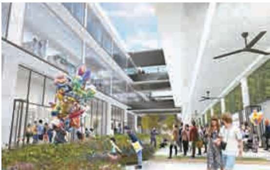
▲ 中環街市地下中庭活化後會成為公共休憩空間構想圖