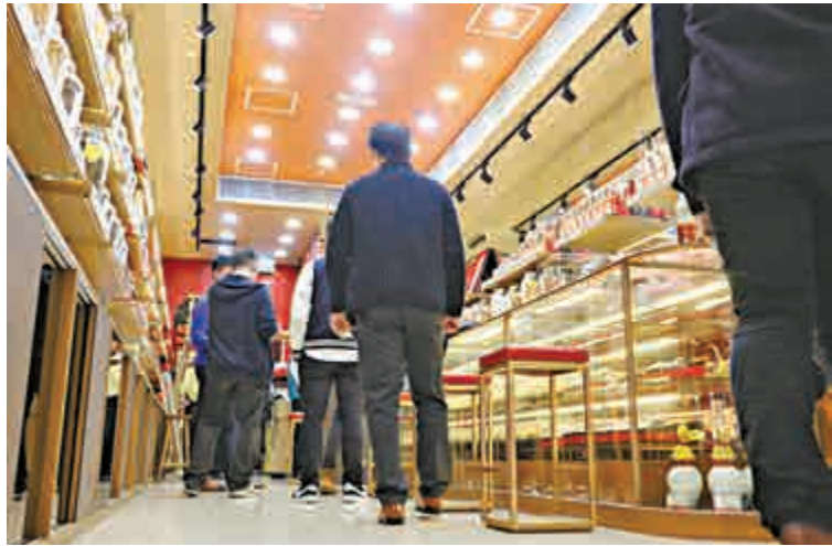
▲ 探員在遇竊東方紅分店內調查

冬蟲夏草有「軟黃金」之稱，最大產區在西藏、四川及青海等地，西藏那曲地區所出產的冬蟲夏草為全球最高品質的冬蟲草，被譽為「蟲草王」。中醫認為冬蟲夏草有補肺益腎等功效，深受港人歡迎。冬蟲夏草每兩售價達兩萬多元，故有「軟黃金」之稱。