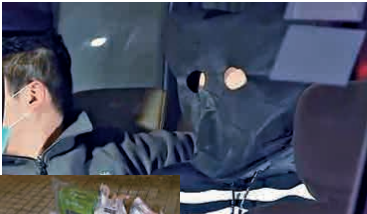
▲ 涉販運毒品19歲青年被捕 電視圖片 ▲ 警方在行動中檢獲逾一千萬元毒品 電視圖片

另訊，香港海關前晚在羅湖管制站，截停一名報稱任職公務員30歲男子，發現他腰間纏有一包約一公斤重冰毒，市值約四十萬元。關員遂將他拘捕，經調查後涉案男子被落案控以販運危險藥物的罪名，今日在屯門裁判法院提堂。