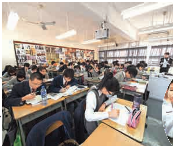
◀▼考試、測驗，以及為應付考試測驗而操練，對學童的影響，不止於增加他們的學習壓力，還對他們的心理和成長打下重要的烙印