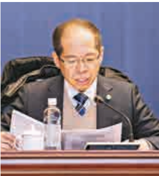
▲中國足協副主席張劍在會議上發言

張劍表示，在國家體育總局和有關方面的指導和支持下，足改方案的各項改革任務得到積極落實。一是推進中國足協調整改革。中國足協的體制機制改革是足球改革的龍頭，其核心是要通過深化改革，創新足球管理體制和運行機制，努力建立專業高效、系統完備、民主開放、運轉靈活、法制健全、保障有力的體制機制，形成強有力的組織保障體系。根據《中國足球協會調整改革方案》，在相關部門的指導下，制定了中國足協人事管理、外事管理、財務工作、機構設置、黨務工作的相關文