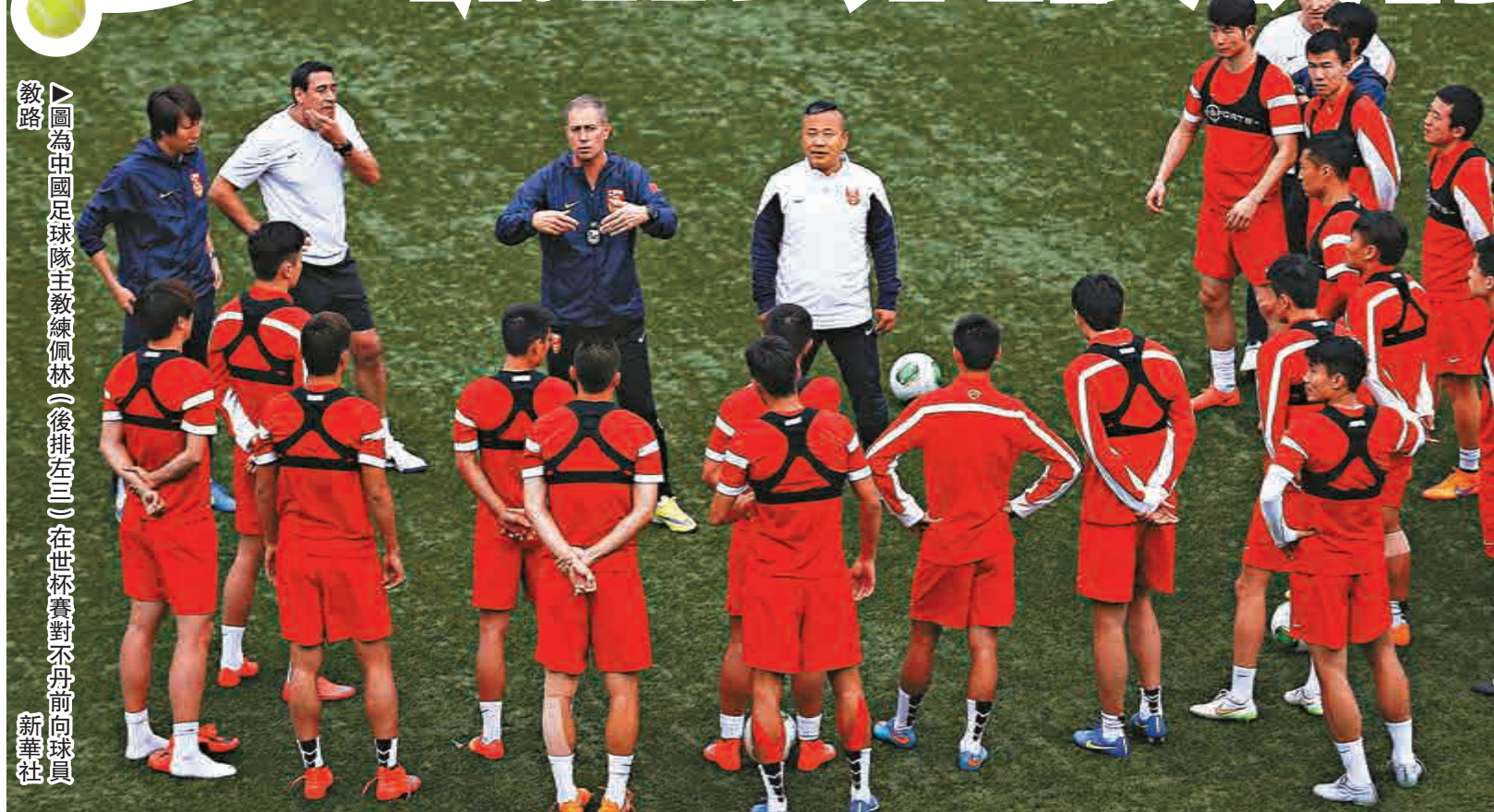
▲圖為中國足球隊主教練佩林（後排左三）在世界杯對陣丹前向球員

蔡振華說：「也許我們的確做得很辛苦，但是不是應該靜下心來認真想想，我們是不是做對了？看看有些國家規劃有序、水到渠成，相比之下，我們是不是有點亂？看看有些國家潛心布局、終成大器，相比之下，我們是不是顯得有點急？看看世界足球日新月異的技術革命、管理革命，我們是不是顯得有點慢？看看別人那些看得見、摸得着、實打實的措施，我們是不是有點懶？」