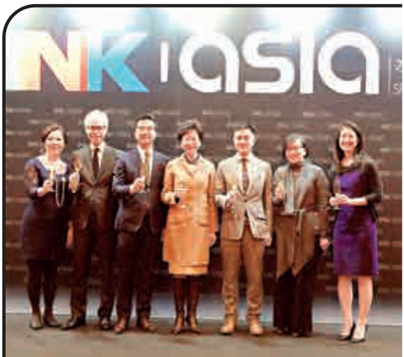
開幕式上主禮嘉賓大合照