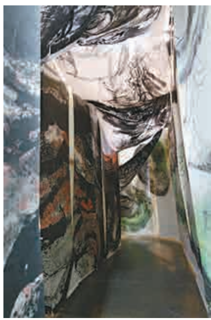
沈愛其大型裝置《水墨里程》(內部局部)