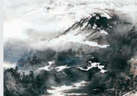
蔡湘君《意國活火山》