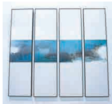
馮永基《宋彩華姿》