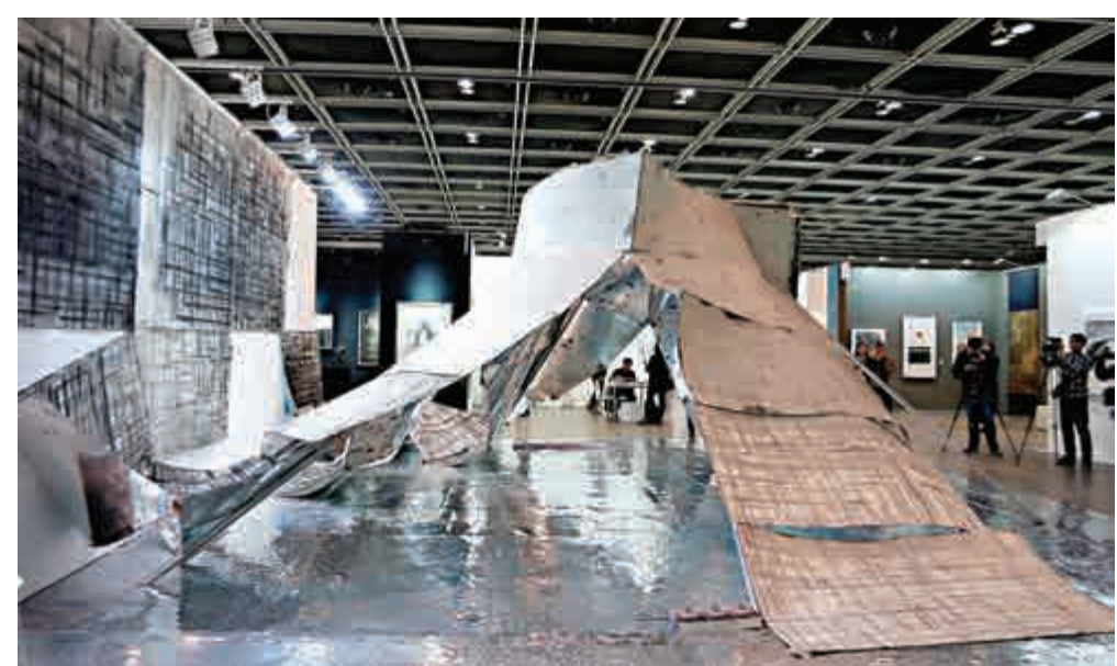
邢聖大型裝置《元·N Dimensions: 無限空間》