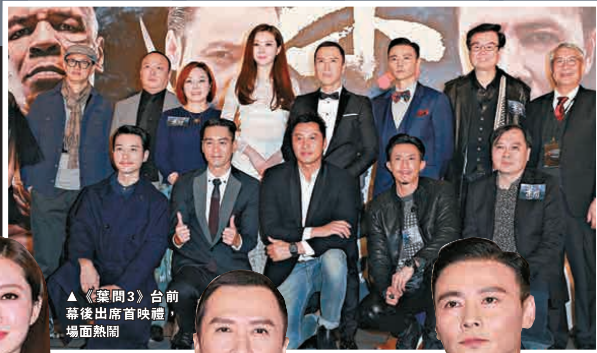
▲《葉問3》台前幕後出席首映禮，場面熱鬧

Lynn表示聖誕會跟男友及其家人去沖繩旅行，但堅稱不會在當地結婚，因為自己做事不太急，也喜歡在自己住的地方結婚。她謂拍拖後講太多感情事，給男友很大壓力，還是少講最好。問她為何不邀請男友出席首映禮？她表示戲中的老公在場，或者等將來自己有老公才帶他出來，她又笑言想盡快。