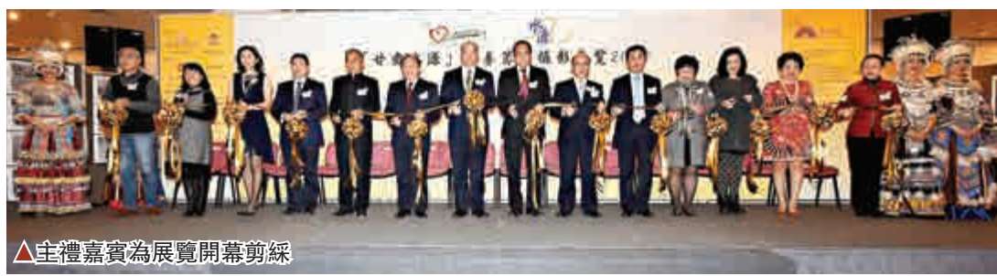
▲主禮嘉賓為展覽開幕剪綵

【大公報訊】心連大地攝影會正在中央圖書館地下展覽廳舉行「甘肅水源慈善攝影籌款展覽2015」，期望籌得善款，減輕甘肅省山區長年乾旱缺乏儲水資源的問題。展期至本月二十二日。