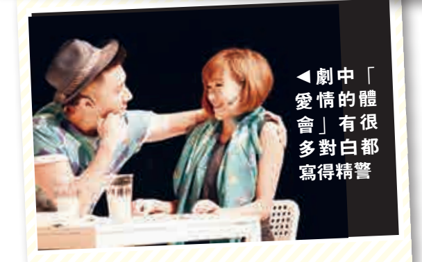
◀劇中「愛情的體會」有很多對白都寫得精警