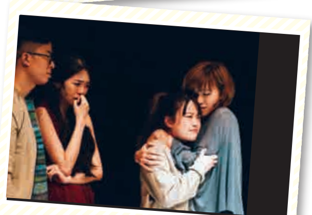
▲劇中男與女之間除了愛情外，也有濃厚的友情