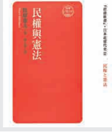
▲香港中和出版有限公司推出第一卷《幕末與維新》（右）和第二卷《民權與憲法》