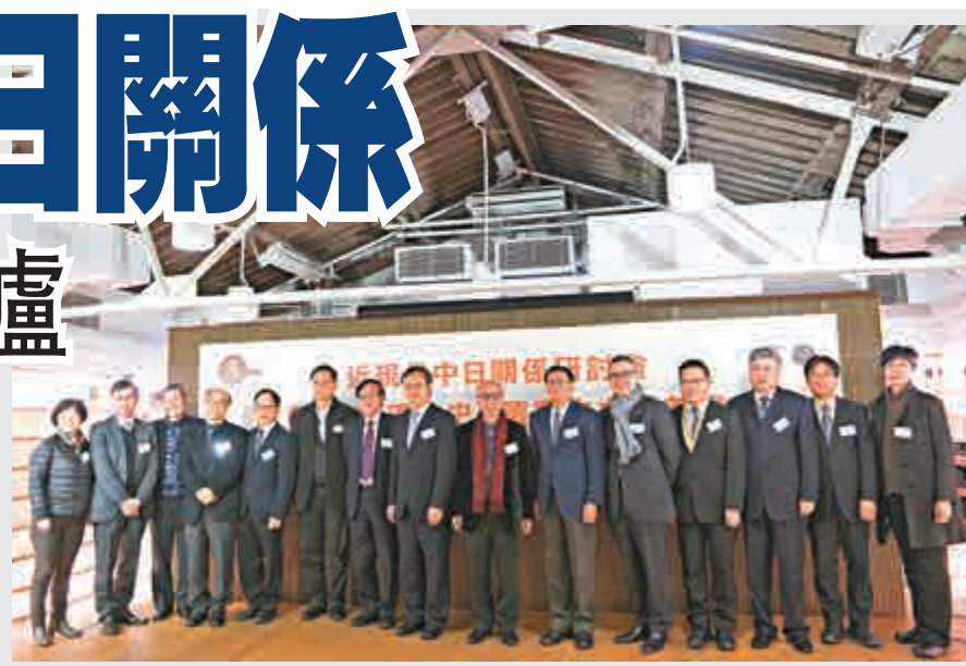
▲嘉賓於「近現代中日關係研討會暨《岩波新書·日本近現代史》叢書首發式」合影

關於日本對於香港的歷史資料分享上，他更提到日本的華僑問題研究家兒弘明，在新亞學院任教期間留下的數部以香港為調查基礎資料而撰寫的學術著作如《香港水上居民：中國社會史的斷面》；還有現存於日本靖國神社的日本將士若林在攻佔香港時所寫的日記等，有利於研究日本與香港的關係特別是現在很少被人關注的日佔時期的香港歷史。