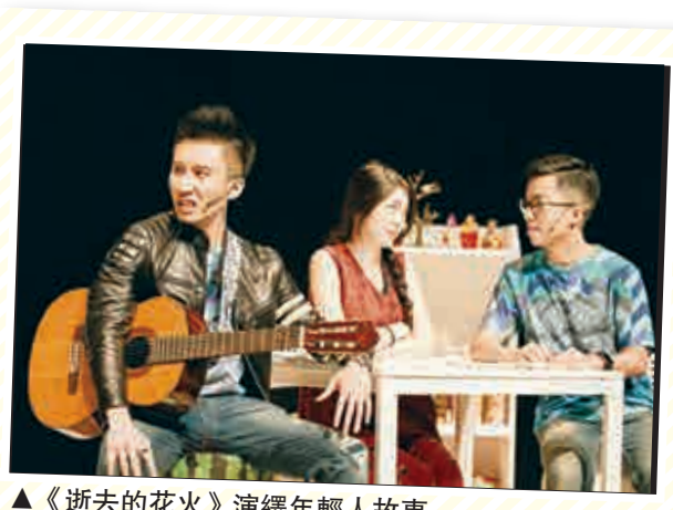
▲《逝去的花火》演繹年輕人故事