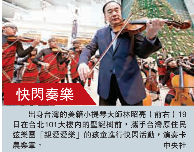
▲出身台灣的美籍小提琴大師林昭亮（前右）19日在台北101大樓內的聖誕樹前，攜手台灣原住民弦樂團「親愛愛樂」的孩童進行快閃活動，演奏卡農樂章。中央社

嘉義縣文化觀光局長吳芳銘說，其中的「縣府3D光雕區」是以3D雷射燈光投影方式，展示的「3D光雕秀」涵蓋嘉義的農業、教育、環保、宗教、藝術及文化觀光等元素。