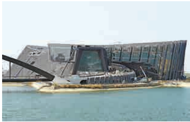
▲正在加緊施工的台北故宮博物院南部院區