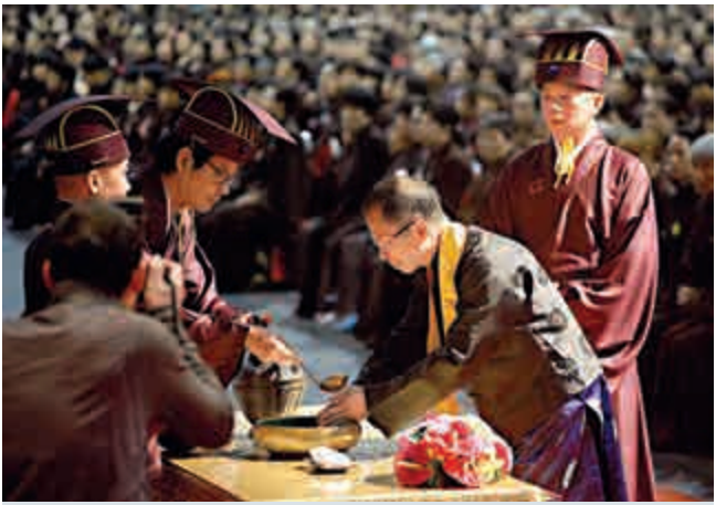
▲立法會主席曾鈺成穿戴傳統服冠擔任主祭官，與禮生、監禮官、陪祭官等在台上主持儀式

【大公報訊】假冒內地官員的電話騙案在香港仍未絕跡，今年11月仍有63宗受害人舉報，損失共338萬元。而今年1月至11月，警方共接獲1315宗「假冒內地官員」電話騙案舉報，其中504宗為有損失案件，涉款約港幣2億6922萬元。騙案高峰期為七月，錄得838宗舉報，損失金額約1億2629萬元。警方稱，近月仍有騙徒假冒內地官員或執法機關人員、不同的速遞公司、內地各省市的郵政、公用事業服務機構人員致電行騙，除要求受害人將款項轉至指定內地銀行戶口外，亦有利用網上理財系統，把受害人內地銀行帳戶的存款匯走。警方呼籲市民保持警覺，如遇到有人自稱執法部門人員或其他機構職員，以不同理由指示交出個人資料，應該主動查證，及再三向相關機構核實來電者的身份，切勿輕信。