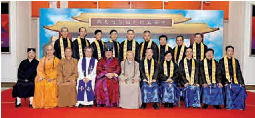
▲祭祖大典盛況空前，來自港澳台、內地及海外八千多名華人親臨參與，一同鞠躬致祭，緬懷祖德，場面莊嚴肅穆