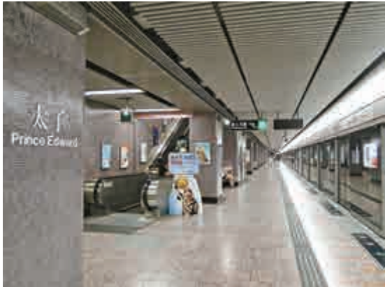
▲一名休班警員涉在港鐵列車前往太子站途中時非禮女子，被警方拘捕

男子盜取十罐總值約309元的調味料，警員經初步調查後，以涉嫌盜竊將他拘捕，帶返旺角警署作進一步調查，但犯人於報案室等候還押期間，約凌晨二時十分，趁機從車輛出口逃走。警員立即在附近一帶兜截，於凌晨約4時40分在通州街發現犯人，以涉嫌從「從合法竊押逃脫」再次拘捕他，該男子現正被扣查。