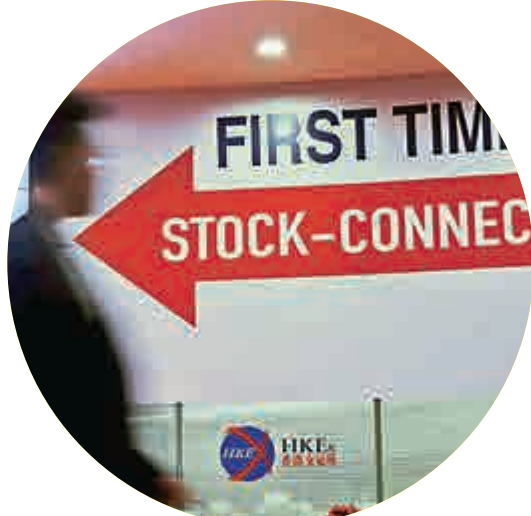
▲市場相信明年深港通必順利通車

有了滬港通的經驗，內地金融市場希望加強與國際接軌，中證監積極推動滬倫通的可行性研究。 另外，今年落實了基金互認，合資格的內地及香港基金可透過簡化審批程序，各自於對方的市場銷售，首批7隻互認基金於12月中完成註冊。