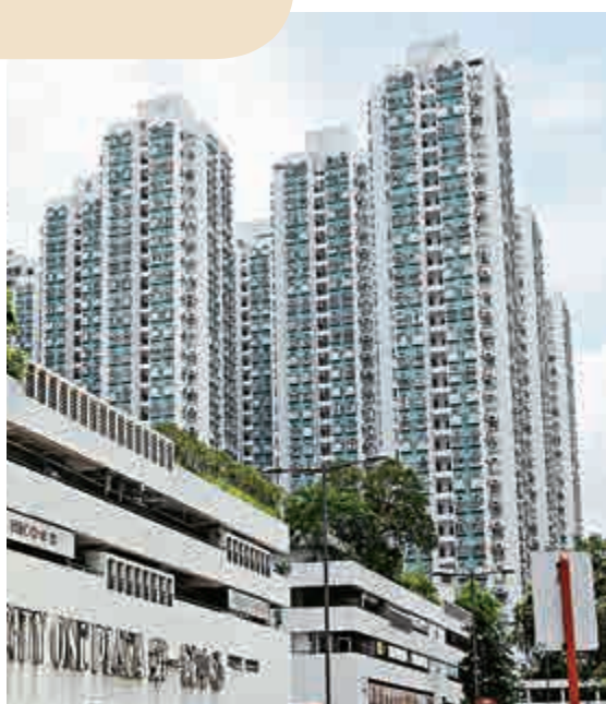
▲飆升的樓價今年下半年開始見頂

不過，行政長官梁振英明確表示，特區政府沒責任保證樓價只升不跌，未來會繼續加大土地供應，解決住屋問題。政府未來會繼續用「雙辣招」來遏抑外來需求、炒賣和投資。