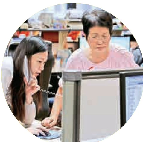
▲ 港股在復活節後踏入「港股大時代」

A股承接去年牛市格局，今年6月12日升至5178點新高。隨着場內槓桿高企、系統性風險上升，監管層多番舉措抑制配資規模。不料引發市場恐慌，大盤6月中旬開始連續重挫，多次出現千股跌停奇觀。為免跌停，A股最多時有1400股停牌，佔牛市總規模逾半。六部委其後聯手維穩，證金公司成為救市先鋒。