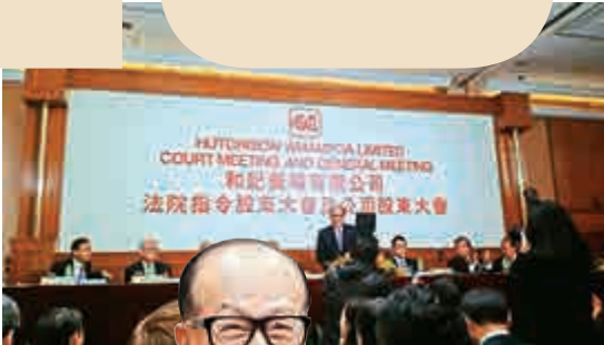
◀長實與和黃 3月完成重組 ，長和系主席 李嘉誠笑逐顏 開

不過，長和系內的長江基建與電能實業合併計劃卻告吹，長建與電能一度調整交易條件，將原本建議每股電能換取1.04股長建股份提升至1.066股，特別股息亦由每股5元調高至7.5元，但最終仍被電能小股東以近50%的比數反對，令重組建議未獲通過。