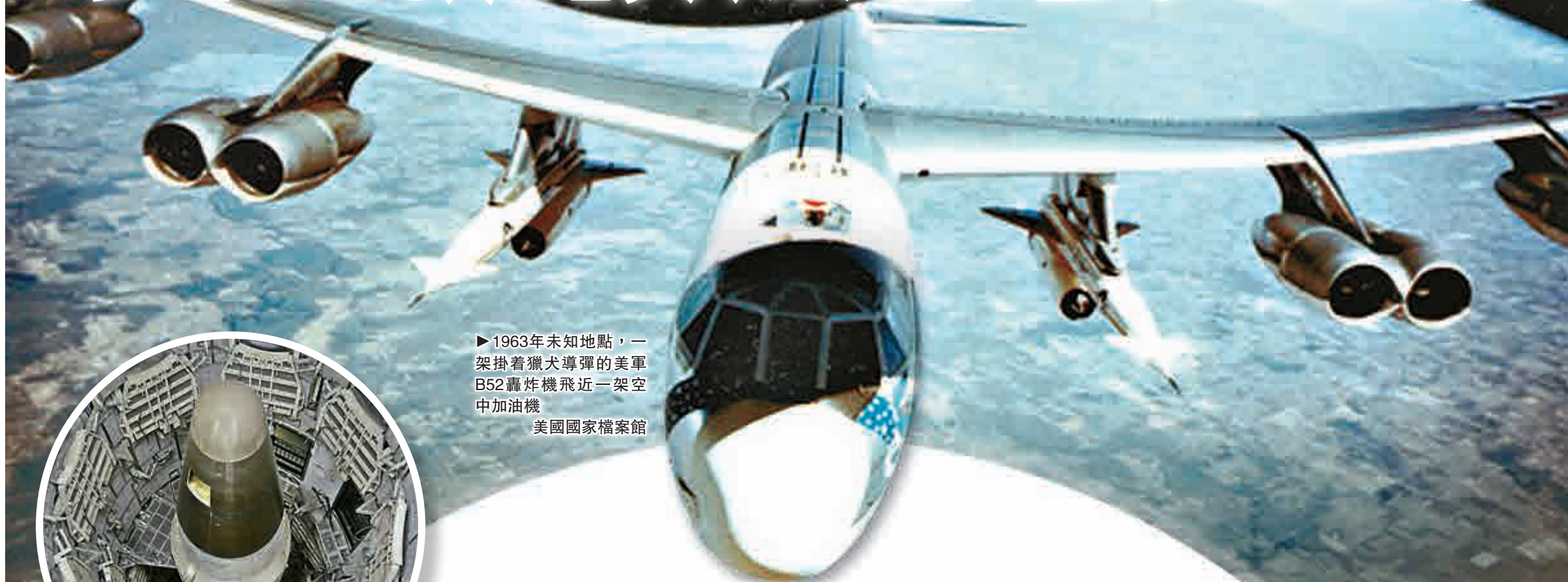
►1963年未知地點，一架掛着獵犬導彈的美軍B52轟炸機飛近一架空中加油機