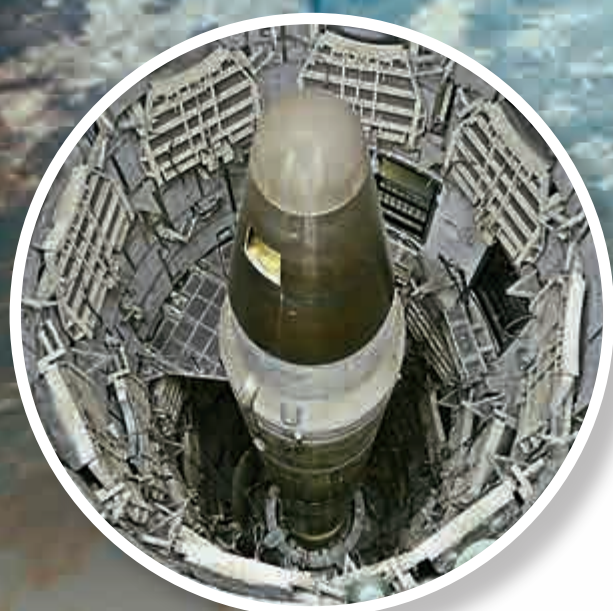
▲美國泰坦導彈博物館展出一顆未激活的泰坦II核彈