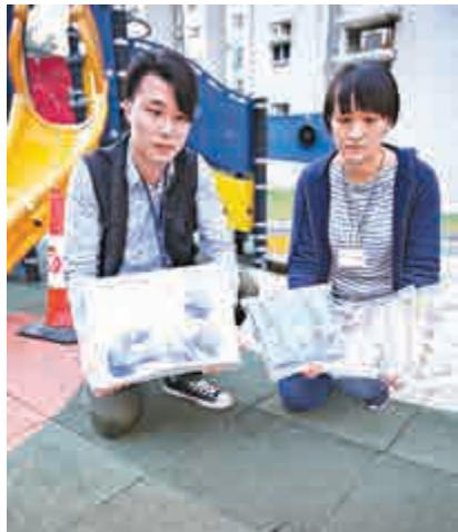
▶探員展示被捕下的兩個啞鈴

經過通宵追查，探員卒鎖定涉案目標單位，至昨午二時探員拖至該單位，經警誠一名16歲就讀中五的男生承認與擲物案有關，探員遂將他拘捕及通知他父母到警署。消息稱，被捕少年沒有情緒病病歷，生長在小康之家，過往亦沒有犯同類案件紀錄，初步不排除有人放假在家，無聊下為尋刺激而擲物落街。警方指，富寧花園至今共收到六宗高空墮物報案，暫時未有人受傷的記錄。警方呼籲市民不要高空擲物，否則隨時會危及他人生命。