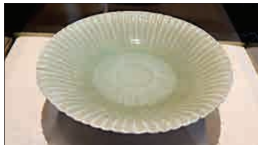
▲從「南海一號」出水的浙江龍泉窰系青釉菊瓣紋碗