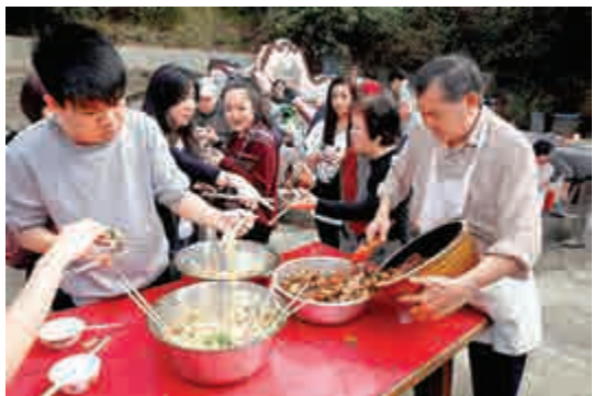
萬宜灣村民在大王爺神壇前吃炆豬肉盆菜

最有特色的是大王爺還神，四姓各派出代表，分成四組，每年輪流負責籌備還神工作。昔日他們在大王爺神壇前屠宰豬隻，自從神壇遷到木棉山，政府不容許，便改為購買豬肉到來烹調。神壇旁有磚砌爐灶，村民燒柴生火，以客家方式用芽荳炆豬肉，配以蔬菜、粉絲、豬皮、豆卜等，色香味俱全。弄好的佳餚分成多盆，四姓村民在神壇前享用，如同吃團年飯一樣。