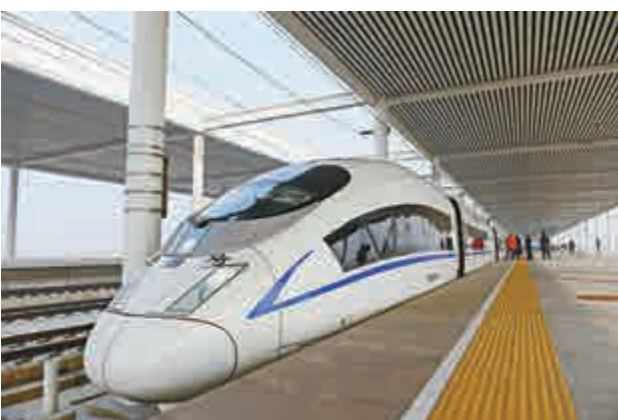
▲12月28日，由天津西站始發的G6271次列車在保定東站停靠