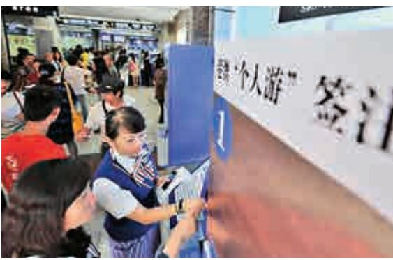
▲10月15日，廣西南寧市公安局出入境管理分局啓用自助辦理廳

此外，還一併公布了公安部以及31個省級公安機關出入境管理部門的服務監督電話，廣大群眾在申請辦理出境證件時，如發現與公告事項不一致等情況，可隨時撥打電話進行投訴反映，一經查實，公安機關將嚴肅追究相關人員的責任，並將處理情況反饋給投訴人。