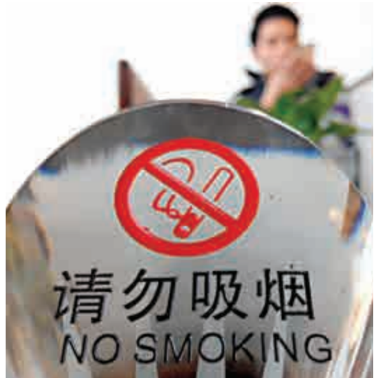
▲12月28日，中國疾病預防控制中心發布調查報告稱，中國吸煙人數較5年前增長了1500萬，高達3.16億。圖為福州一家酒店內擺放着請勿吸煙的標識

此外，《2015中國成人煙草調查報告》指出，吸煙者戒煙行為無明顯變化，煙草廣告和促銷