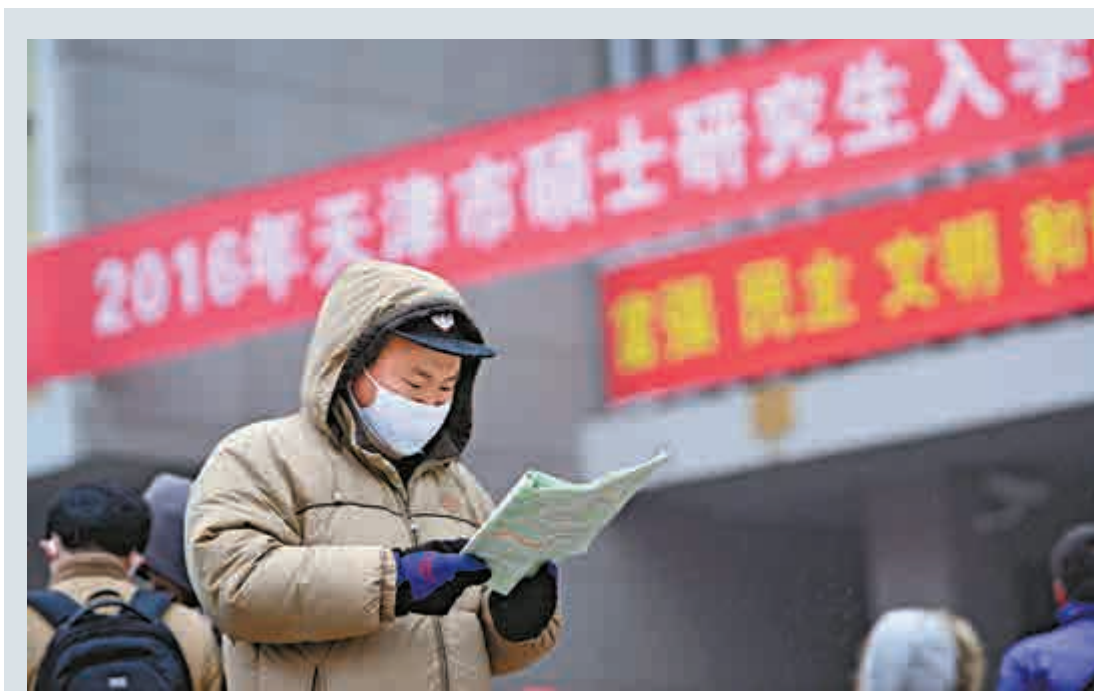
▲12月26日，在天津南開大學考點，考生在等候入場

專家表示，經濟增長乏力，就業形勢嚴峻可能是導致此次報名人數出現反彈的重要原因。其中，報考專業學位人數為85萬，佔全部報考人數的48%。