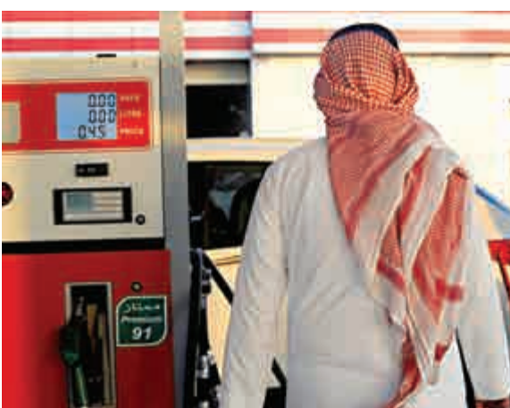
▲一名沙特男子28日經過紅海港口城市吉達的一個加油站