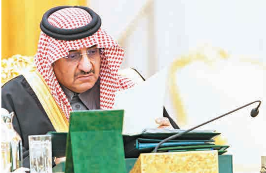
▲沙特內政部長納伊夫王子28日在內閣會議上閱讀財政改革措施文件

沙特經濟政策作出近年最大規模改動之時，中東地區局勢越來越動盪。沙特在緊縮開支的同時增加軍費開支，2016年有569億美元（約4438億港幣）預算作軍事及保安開支用途，以支持敘利亞反對派，並協助也門打擊當地胡塞叛軍組織。沙特稱，今年有53億美元的赤字，是受也門軍事行動開支增加影響。