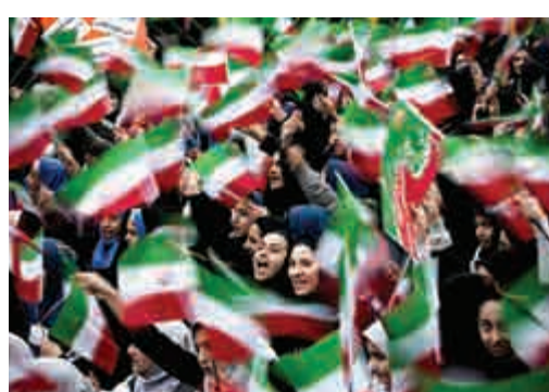
▲伊朗婦女手持國旗在德黑蘭的自由廣場慶祝核協議達成

伊朗與伊核六國（美、英、法、俄、中、德）今年7月達成伊核問題全面協議。根據協議，伊朗將着手削減大約三分之二的離心機和絕