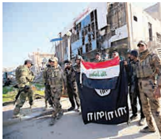
▲伊拉克政府軍28日手持伊拉克國旗和ISIS的旗幟，慶祝重奪重鎮拉馬迪