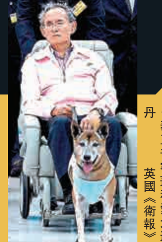
▲泰王普密蓬和愛犬通丹

通丹最終於本月26日因器官衰竭，以17歲的高齡去世。據了解，通丹在泰語是銅的意思，泰國媒體通常使用意思爲「夫人」的敬語「坤」稱呼牠。