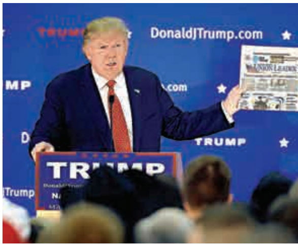
▲共和黨候選人特朗普28日在競選活動上講話

特朗普針對希拉里的人身攻擊其實並非首次。21日，在密歇根州舉行的競選活動上，特朗普用十分粗俗的言語對希拉里進行人身攻擊，稱其在辯論會上去洗手間「很噁心」。在談到2008年希拉里退出總統大選一事，特朗普說：「當時，大家都認爲她有機會擊敗奧巴馬。但最終她卻被幹掉了，我的意思是，她輸了。」外媒對此評論稱，劣跡斑斑的特朗普語錄再次被證無下限。