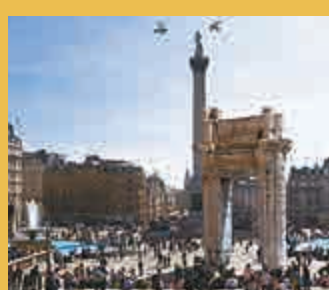
▲3D帕爾米拉古城拱門電腦模擬圖

【大公報訊】據英國《每日郵報》報道：極端組織「伊斯蘭國」（ISIS）惡意破壞了不少珍貴古蹟，其中包括敘利亞著名的帕爾米拉古城。英國牛津大學的考古研究所（IDA），現正開展一項計劃，打算利用全球最大的3D打印機，重製古城的拱門部分。