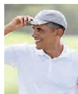
▲奧巴馬和希拉里獲選年度最受仰慕男女