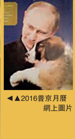
▲2016普京月曆

新年禮物的全名叫做《改變世界的話 弗拉基米爾·普京的重要引文》。據報道，這本書近400頁，按照時間順序排列，收錄了近年來普京的經典講話。書的正文從2003年普京在聯合國大會上的講話開始，以今年的聯合國大會講話結束。書中還包括普京慕尼黑講話、2008年CNN訪談、2012年選舉前演講等。