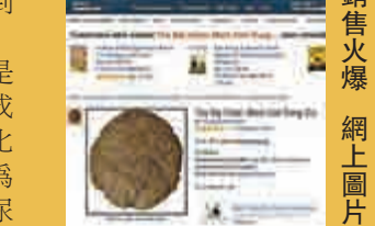
▲印度牛糞餅電商銷售火爆

亞馬遜印度分部的發言人指出，從10月開始很多人在網絡上買牛糞餅，反應也相當不錯。也有當地網絡零售商表示，燒牛糞餅會有一股獨特的泥炭味，對於從小在農村長大，後來到城市工作的人來說，有一種「懷念」的味道。