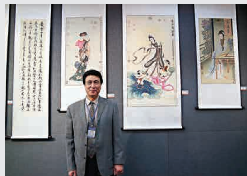
▲方威筆下的《西域公主》（左二）別有一番韻味

查詢展覽詳情可電二九一五六三一二，或瀏覽主辦方網頁：blog.sina.com.cn/worldchinesearts。