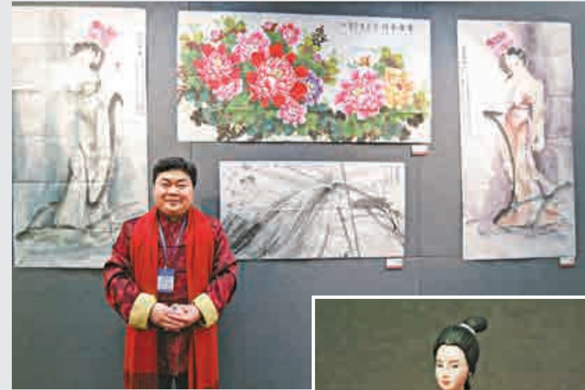
▲洪飛善畫美人、牡丹，《富貴吉祥》（中上）為其得意之作 大公報記者卞卡卡攝