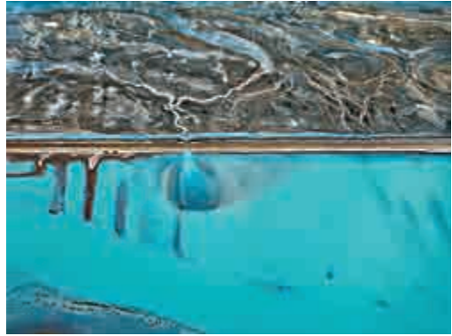
▲《水跡》以超高清錄像把來自世界各地有關人類與水的故事連繫起來