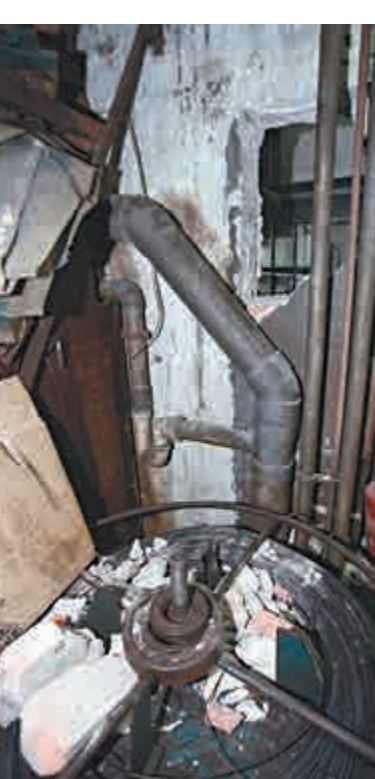
▲瑞和街參茸店後舖的牆壁被擊穿一個窿