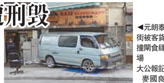
▲元朗泰祥街被客貨車撞閘食肆現場

案發現場為泰祥街35號地下一家食肆。據報該食肆上周五曾遭人擲紅油彈破壞，警方初步不排除兩宗案件為同一幫人所為，正調查兇徒動機。昨清晨六時