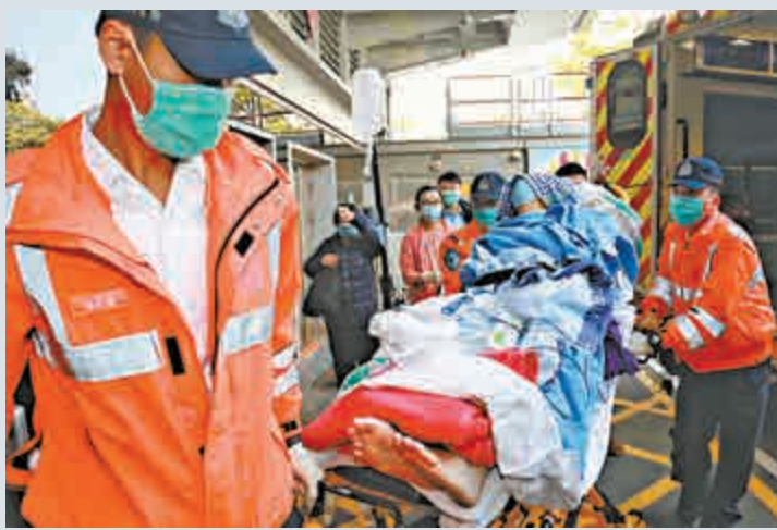
遭女友連斬兩次男子送院

將軍澳健明邨停車場內，昨清晨發生聳人聽聞傷人案。一名有婦之夫男子，疑欲與學護女友分手，但女友糾纏不分，兩人前晚在女方上水家中為感情問題爭執，其間有人用雙刀連斬男事主六刀，但他只是皮外傷，經女友治理後未有生命危險。至昨晨女學護駕車送男友返將軍澳途中，又再為分手問題爭執，有人將車駛入停車場內，用第三把刀直刺男事主腰背，男事主腎臟受創重傷，幸停車場保安員及時發現報警求助。警員到場將女事主拘捕，男事主送院治理後情況嚴重。