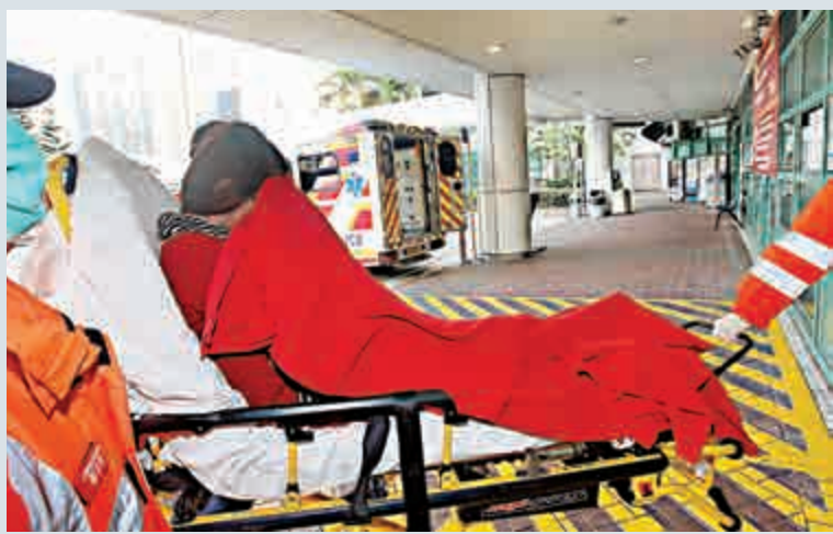
涉連斬男兩女子受傷送院