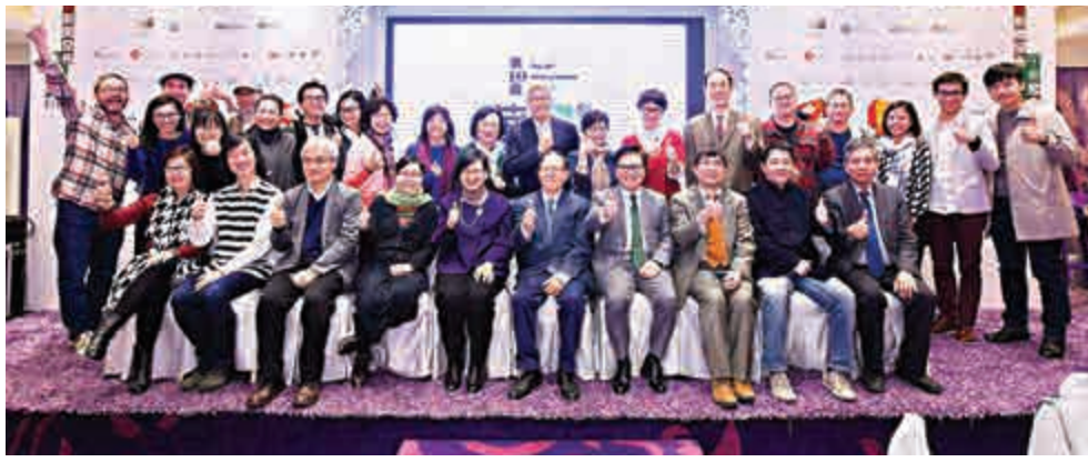
▲現場嘉賓及各製作機構合影

此外，本屆華文戲劇節特設兩岸套票優惠，以鼓勵更多香港觀眾走進劇場。戲劇節同時包括研討會及華文戲劇節二十年回顧展，令香港觀眾對華文戲劇有更深刻的認識和了解。