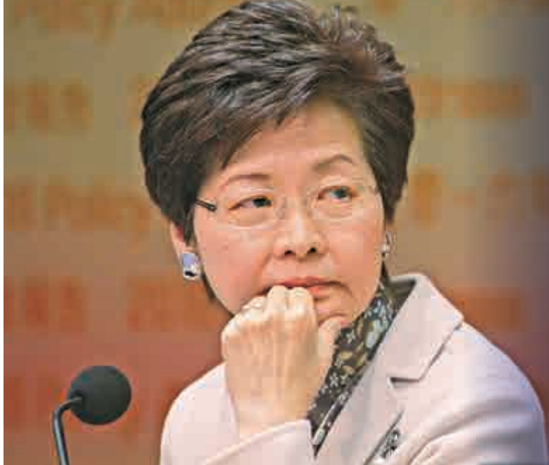
▲立法會上周四二讀審議《版權修訂條例草案》期間再次流會 資料圖片