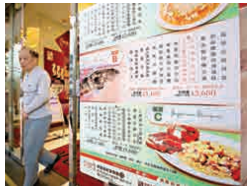
▲消委會指食肆牌價應明確實價免收費爭拗

消委會測試的十款空氣淨化機售價由1690元至5390元不等，其中最便宜的樣本，機價是1690元，但每年需要更換過濾器及活性炭濾網，以十年計算，連機價的總花費達5650元，是機價的3.3倍。消委會建議消費者，購買空氣淨化機，應考慮整體支出和功能表現。