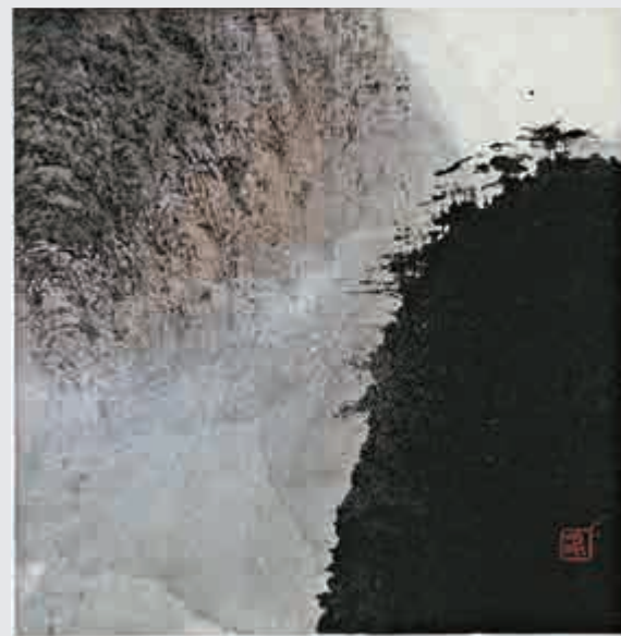
▲左起：《天與地》(一)、(二)、(三)