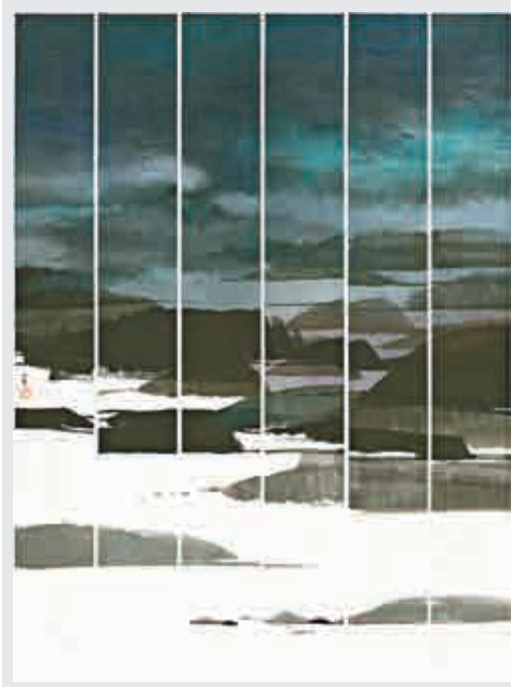
▲六屏作品《拾》，是畫家在六十歲送給自己的禮物