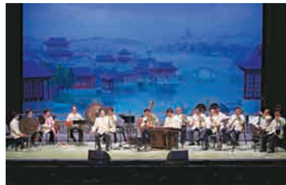
▲香港潮樂演奏團本月底將舉行「潮州音樂會」