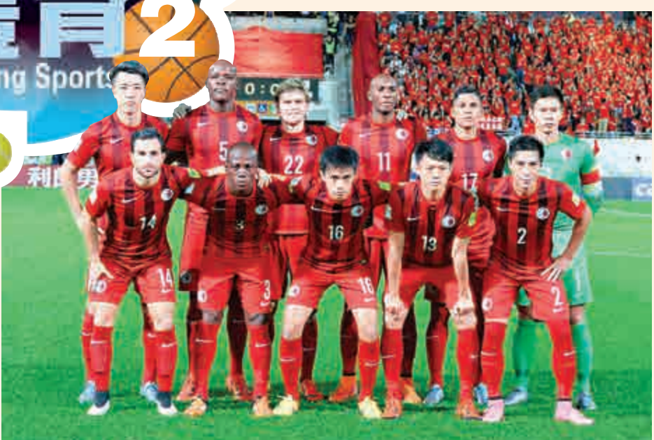
▲在世杯外表現出色而受全港關注的港足，將參加賀歲杯

【大公報訊】記者李恆基報導：香港足總接手主辦今年的賀歲杯足球賽，暫定年初二（2月9日）下午3時在旺角場舉行，構思由香港足球代表隊對香港聯隊選手隊，這將是賀歲杯首次無外隊角逐。足總行政總裁薛基輔表示，足總管理團隊今日的例會將討論申辦今年11月的東亞足球錦標賽第2階段外圍賽。